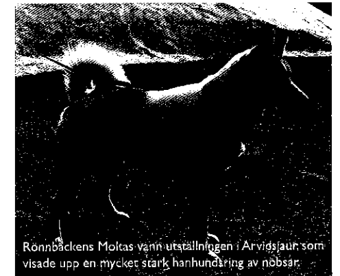
Rönnbäckens Moltas vann utställningen i Arvidsjaur, som visade upp en mycket stark hanhundsring av nobsar.