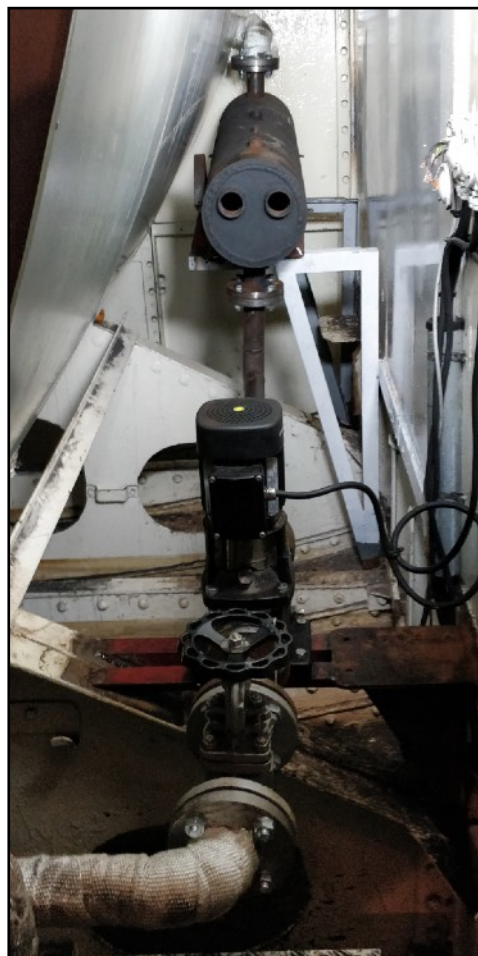
Forvarmer og pumpe på plads