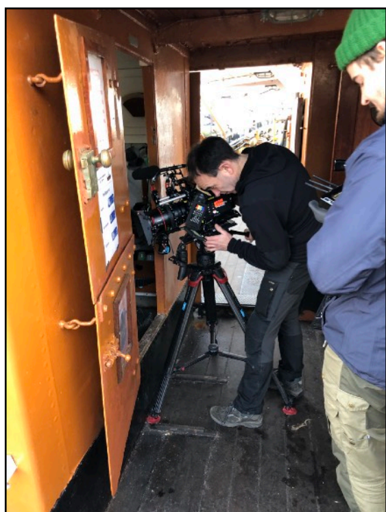
Der filmes i pantryet