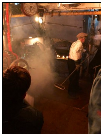
Masser af teater røg