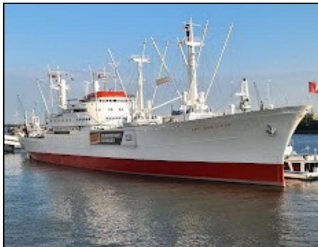
Cap San Diego

I Hamburg Havn ligger museumsskibet Cap San Diego. Det er en reefer fra 1961, på 159 meters længde.