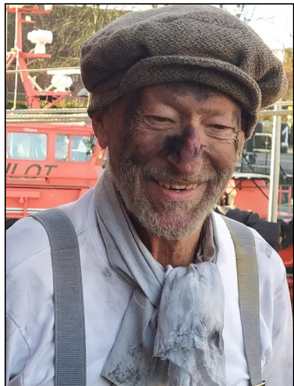
Fyrbøder anno 1938