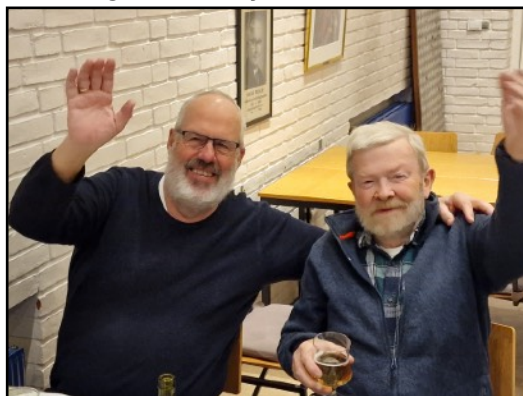
Godt humør ved julefrokosten

Vi havde et julelotteri med masser af gevinster i form af cd'er, dvd'er, chokolade, specialøl og vin og overskuddet på lige knap 1400kr. gik selvsagt til S/S Bjørn.