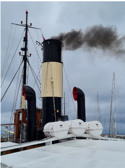
Endelig er der røg fra skorstenen. Meget røg!