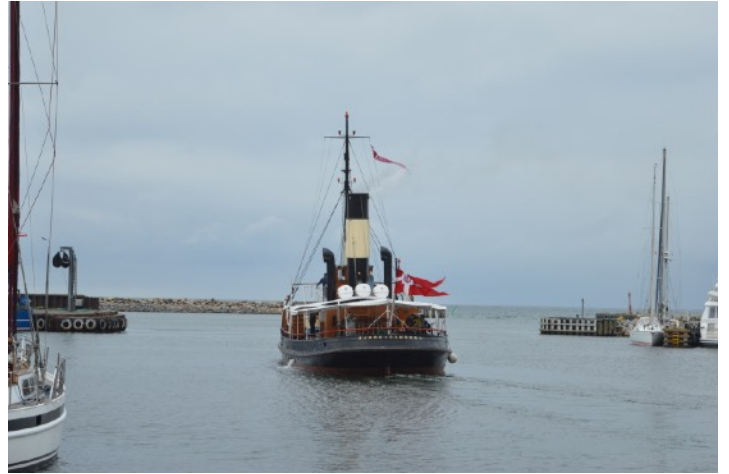
Farvel til Gilleleje