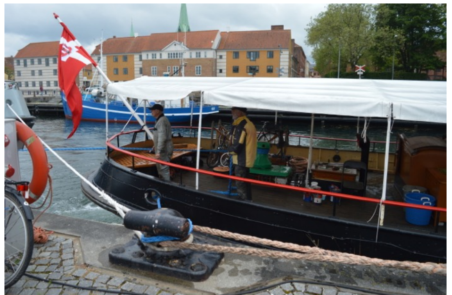
Hjemme på egen kajplads

Husk at du kan læse mere om arbejdet i remisen og på Bjørn, på hjemmesiden og på Facebook.