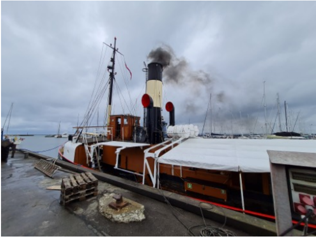
Klar til afgang fra Gilleleje