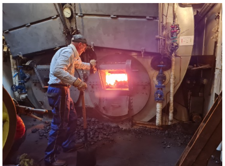
Sigurd fyrer i vores nye kedel