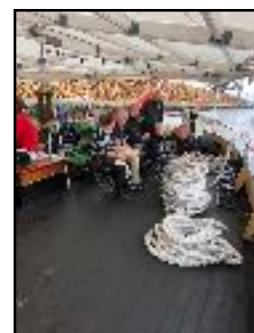
Kapstansen i Randers 2018