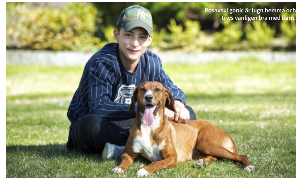
Posavski gonik är lugn hemma och trivs vanligen bra med barn.