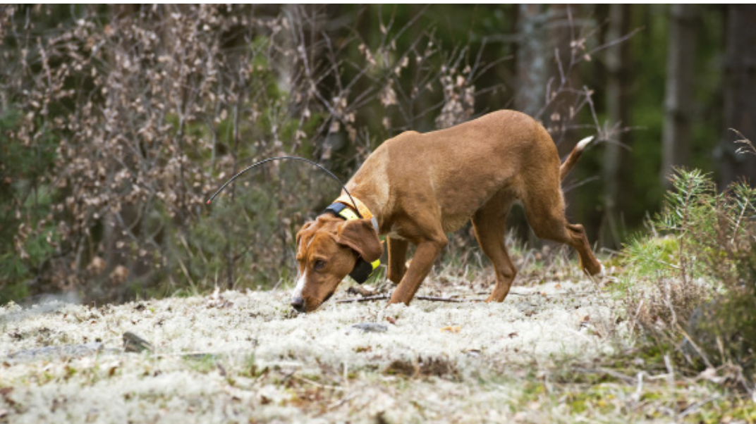
Posavski gonik är känd för sin goda spårformåga och tar gärna an även kalla slag.

lämpar sig särskilt väl för jakt på hare, räv och vildsvin.”