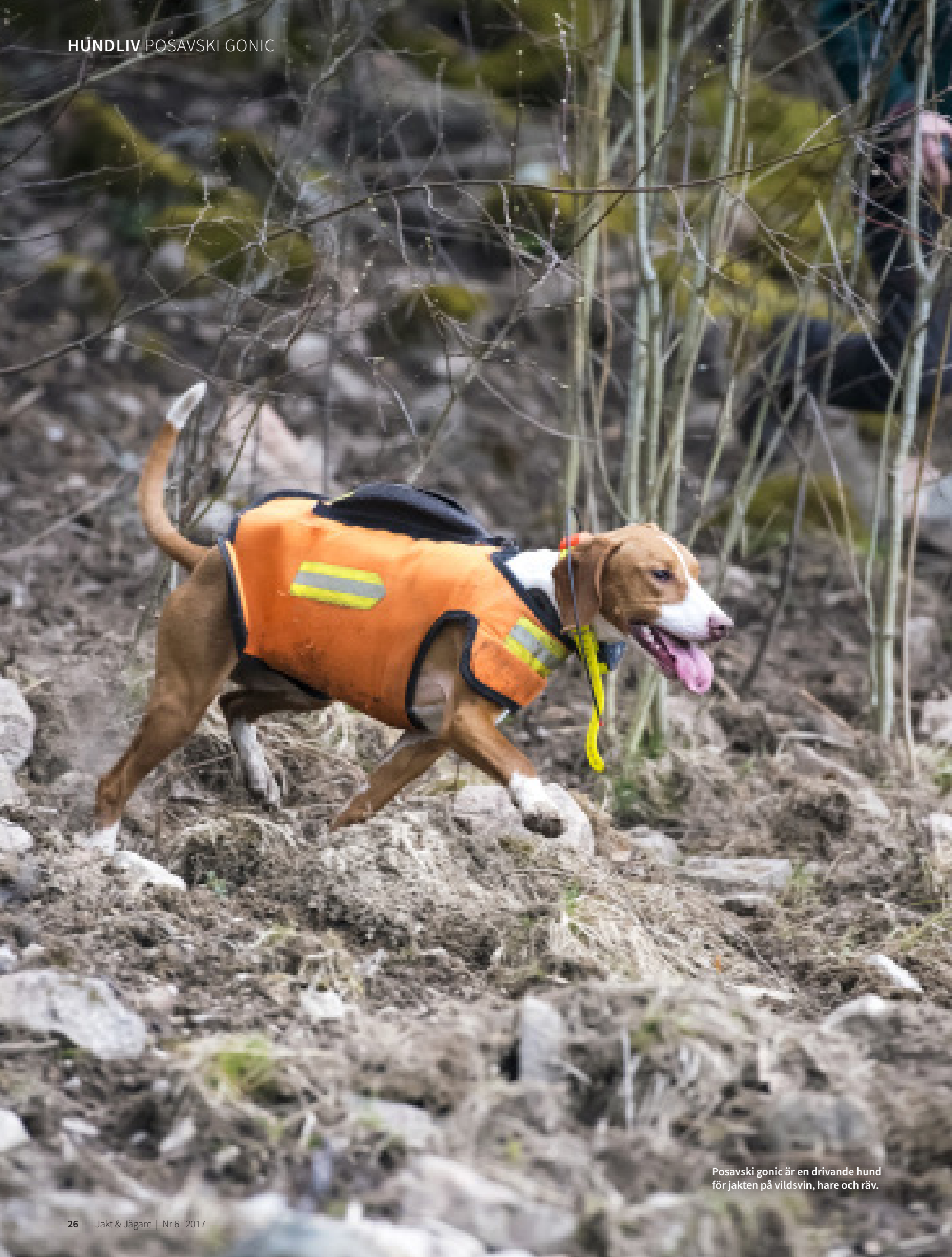
Posavski gonic är en drivande hund för jakten på vildsvin, hare och räv.