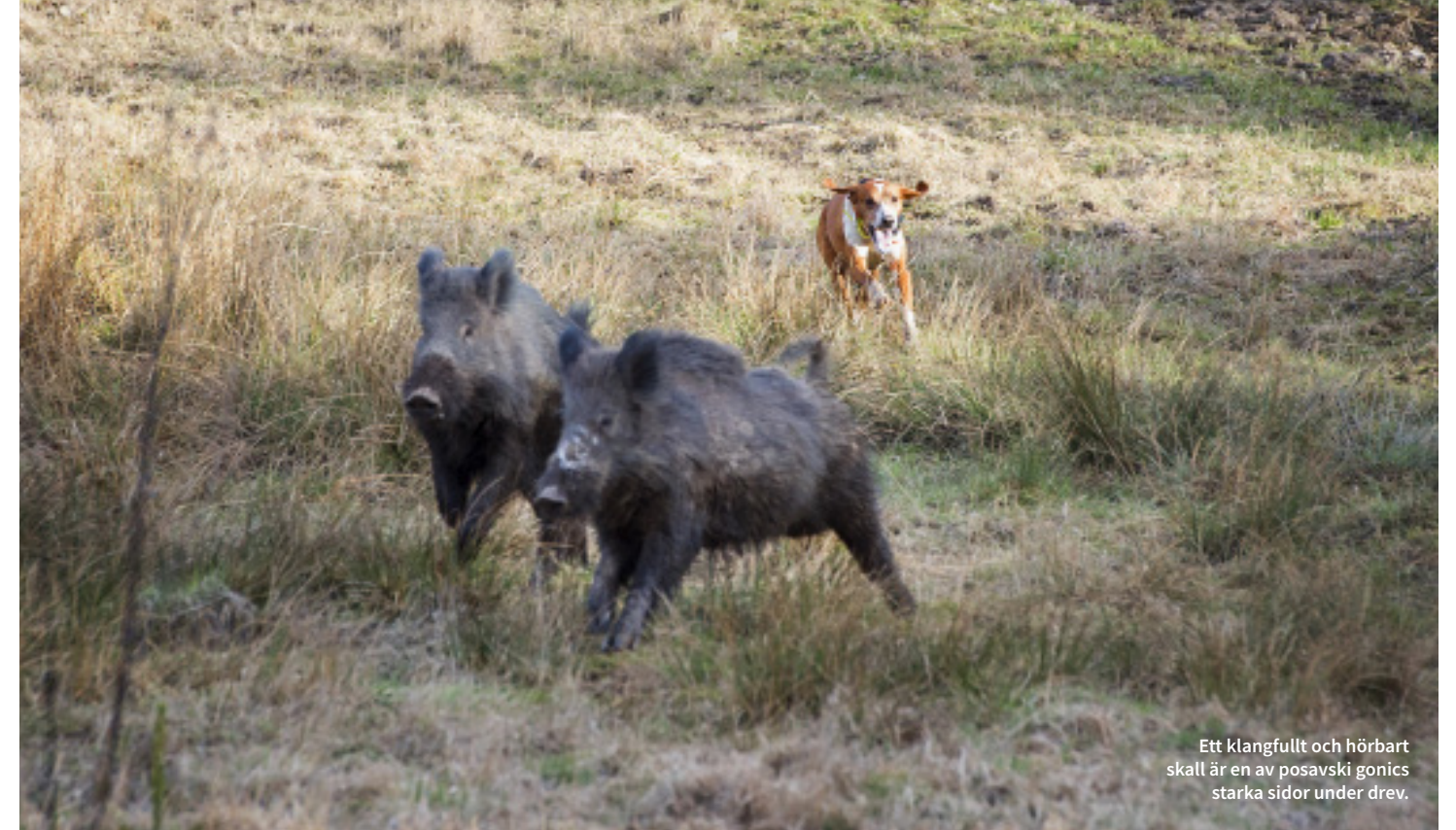
Ett klangfullt och hörbart skall är en av posavski gonics starka sidor under drev.