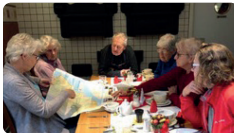
Die Teilnehmer*innen bei der Weihnachtsfeier

Alltagsthemen, aber auch über Reisen, Politik, Literatur und Speisen anderer Länder. Die meisten sind „Wiederholungstäter“, belegen diesen Kurs alle Jahre wieder, um die gelernte Sprache anzuwenden und das Gehirn auf Trapp zu halten.