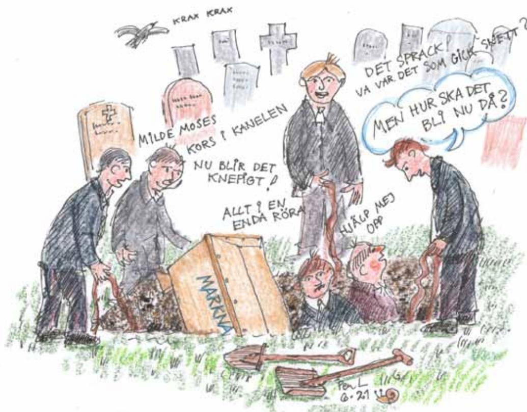
ILLUSTRATION: PER LINDROOS