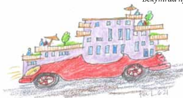
ILLUSTRATION: PER LINDROOS