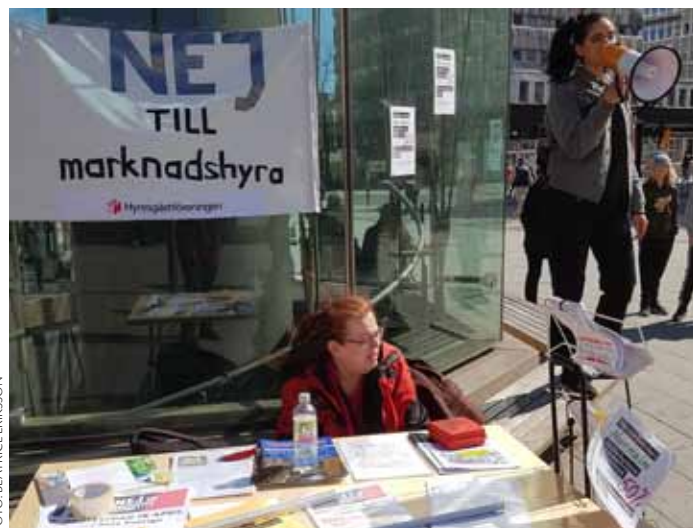
Ett soligt Odenplan 18 april. Hyresgästföreningen Norrmalm, Nej till marknadshyra och talare bl.a. från Feministiskt Initiativ gjorde protestdagen väldigt lyckad.

Vi har klarat denna stora mobilisering utan budget, reklamkonto eller kommunikatörer. Det är en enorm framgång som bygger på att aktiva gräsrotter har verkat inom sina respektive organisationer. Ett särskilt tack till