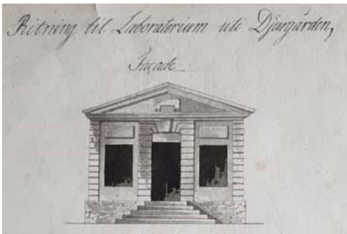
Ritning av Kruthuset från 1799 av C G Ramsay. Kruthuset står kvar, ta gärna en promenad i parken,

Enligt Förbundet Ekoparken behöver nu staten, Stockholms universitet, Vetenskapsakademien och Stockholms stad enas om en långsiktig plan för förvaltning.