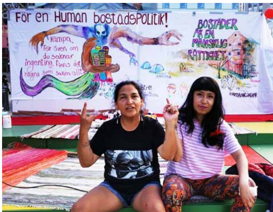
Oroliga hyresgäster på Medborgarplatsen.