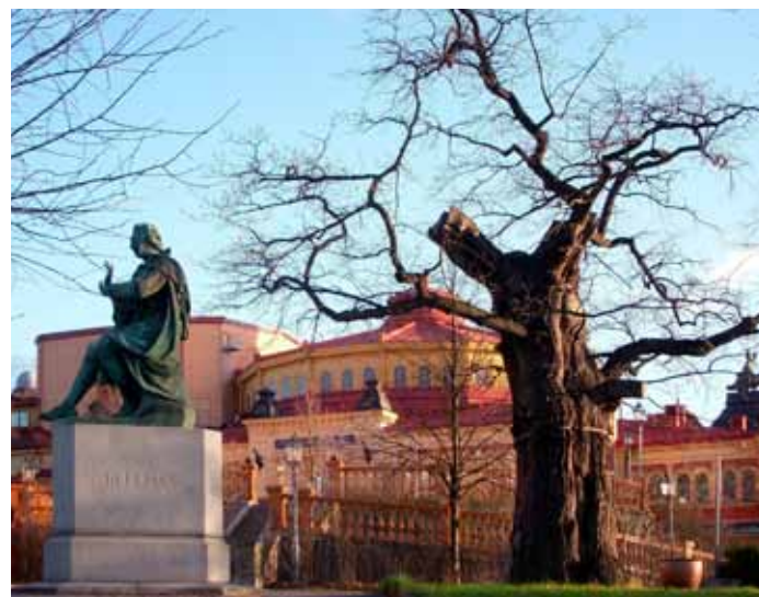
Bellmansstatyn och Bellmanseken utanför Hasselbacken. I bakgrunden Cirkus.

Flera planer har presenterats. En är att binda ihop Hasselbacken med Cirkus, Abbamuseet och delar av Konsthallen för att konsolidera turistattraktionerna. ABBA-museets ägare har tagit över Cirkus. Företaget Pop House med Björn Ulvaeus som en av huvudägarna vill också utvidga hotelldelen. Företaget siktar på ett omfattande ägande av olika kultur- och nöjesinstitutioner på Södra Djurgården. Men det finns ett starkt motstånd från boende och institutioner som värnar Djurgården, bland annat Skönhetsrådet. Hyresgästföreningen Östermalm har avstyrkt planerna.