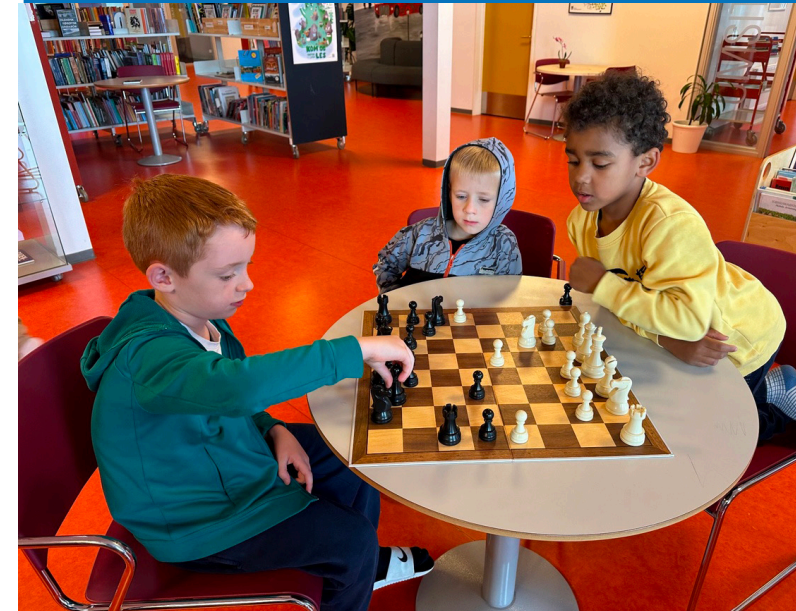
Mynd: Skúlin á Argjahanri

Foreldraumboð verða vald í skúlastýrið 12. november 2024