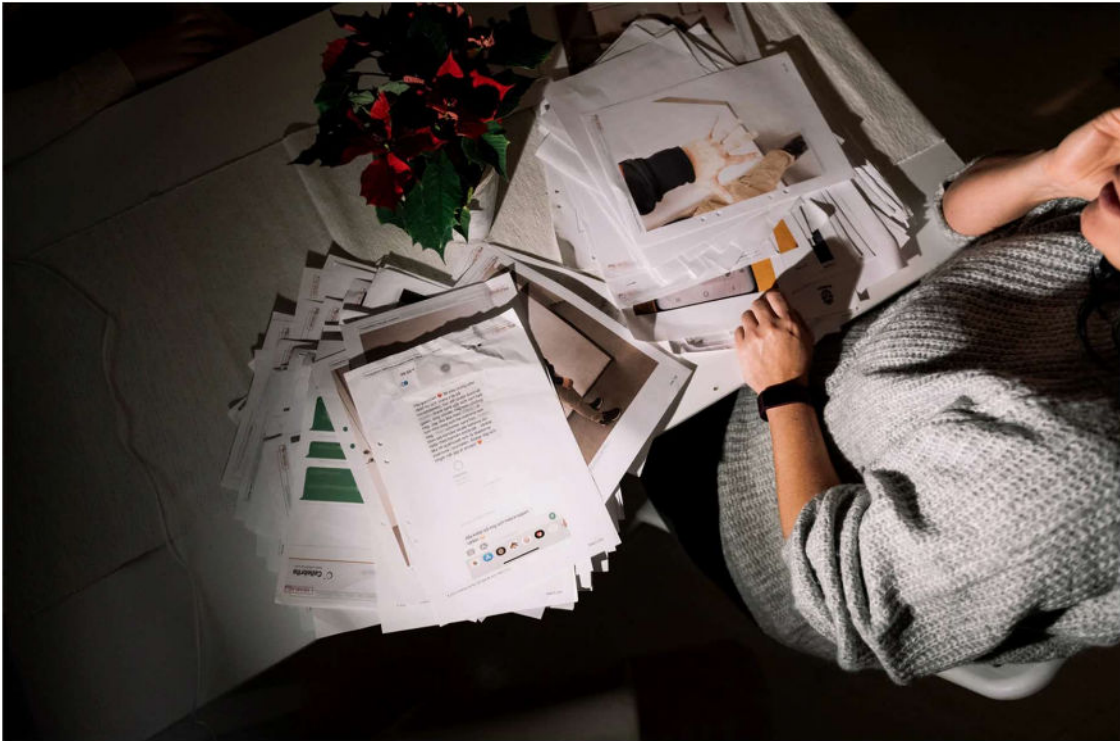
Sofia brukar förvara polisens förundersökning i en papperspåse i garderoben. Hon och vännerna har bestämt att de ska bränna upp dokumenten i en eldtunna i vår, som ännu ett avslut på relationen.