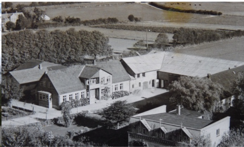
bygget som aftægtsbolig i 1934.