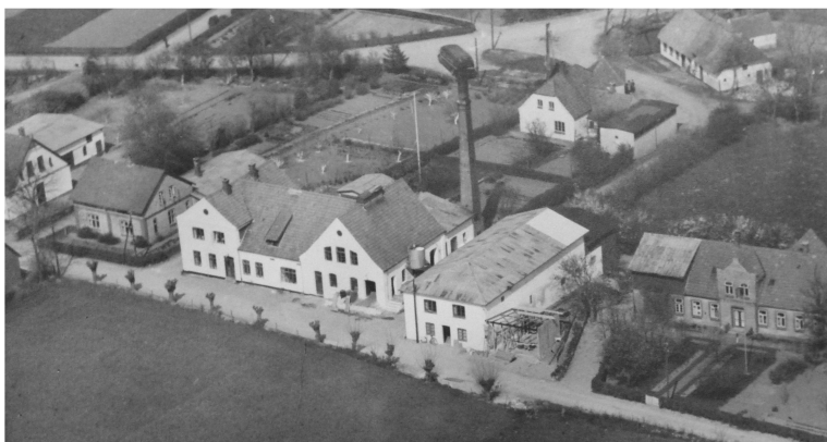
Skelde Mejeri