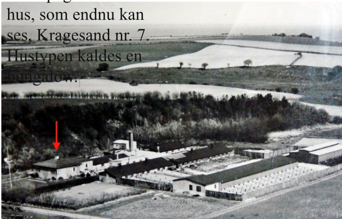
Luftfoto fra 1950'erne

Landsbylaugene og Lokalhistorisk Samvirke for Sønderborg Kommune Hjemmesider: www.skla.dk og www.dyntskelde.dk