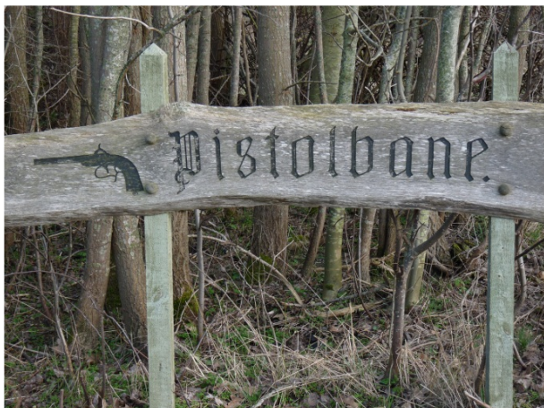
Skydebanen. Skiltet kan ses fra vejen.