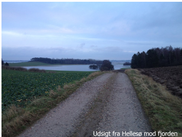
Udsigt fra Hellesø mod fjorden

Den danske forfatter Henrik Pontoppidan (1857-1943) modtog i 1917 Nobelprisen i litteratur for "sin autentiske skildring af dagliglivet i Danmark" bl.a. i novellesamlingen "Fra hytterne" og romanen "Det forjættede land". Begge værker er tydeligt inspireret af dagligdagen blandt landbefolkningen og oplevelser i årene, hvor Henrik Pontoppidan boede i Østby med sin familie.