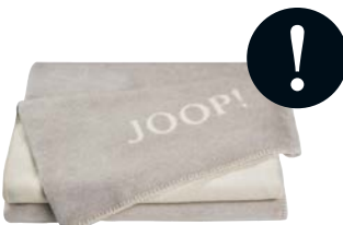
Rauch-Ecrü Art.-Nr. 732316