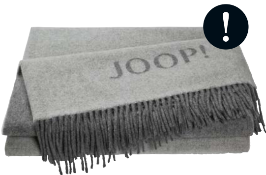
Graphit-Schiefer Art.-Nr. 739834