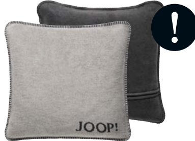
Ash-Anthrazit Art.-Nr. 739469