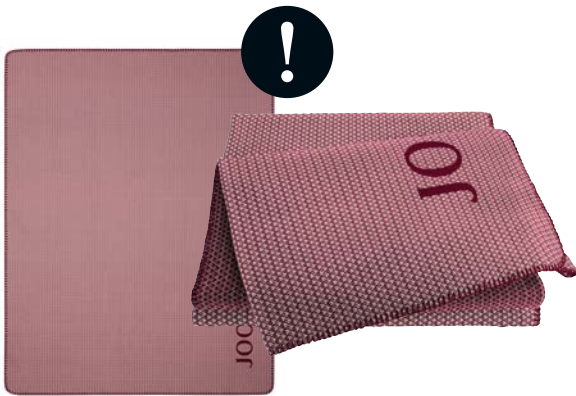
Rouge Art.-Nr. 804570