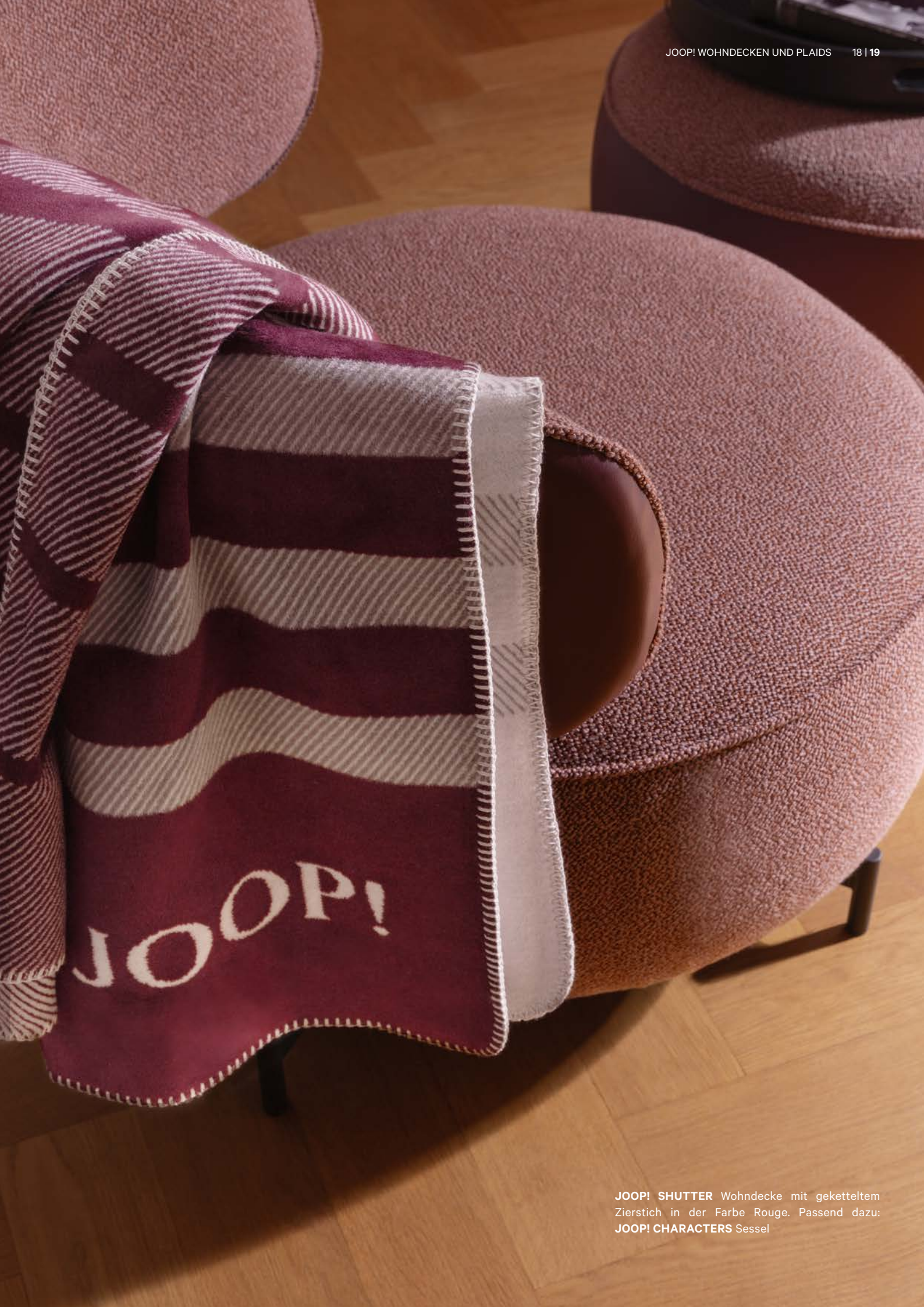
JOOP! SHUTTER Wohndecke mit geketteltem Zierstich in der Farbe Rouge. Passend dazu: JOOP! CHARACTERS Sessel