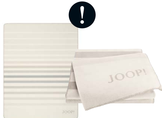
Natur Art.-Nr. 804624