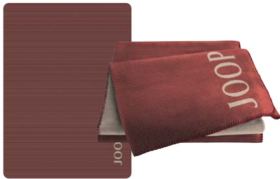
Rouge-Natur Art.-Nr. 804686 Art.-Nr. 804716