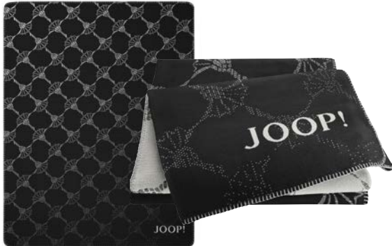
Schwarz Art.-Nr. 804518