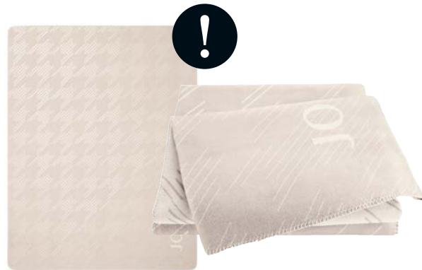
Creme Art.-Nr. 804556