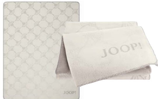
Natur Art.-Nr. 804532