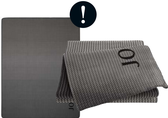
Schwarz Art.-Nr. 804587