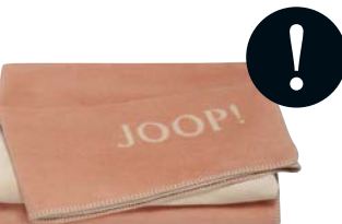
Kupfer-Sand Art.-Nr. 791139