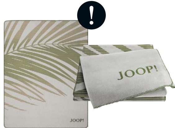
Grün Art.-Nr. 807472