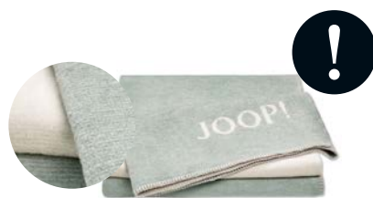
Jade-Natur Art.-Nr. 758712