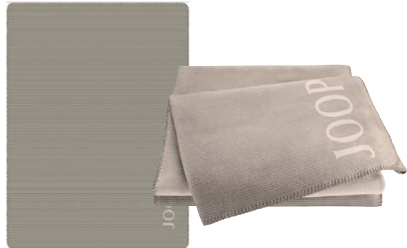
Sand-Natur Art.-Nr. 804693 Art.-Nr. 804723