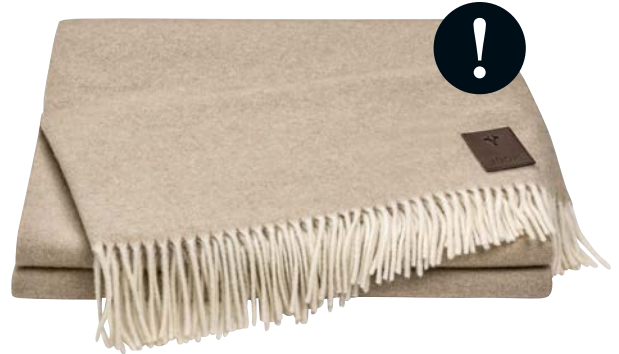
Natur Art.-Nr. 758842