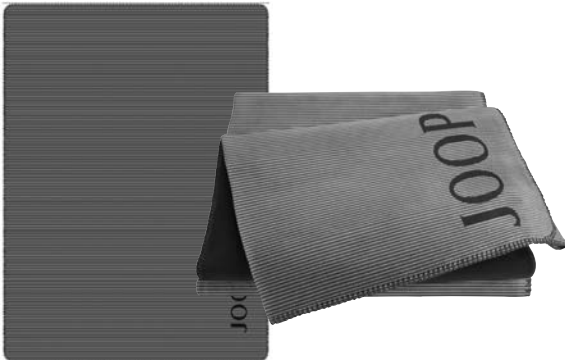
Anthrazit-Schwarz Art.-Nr. 804679 Art.-Nr. 804709