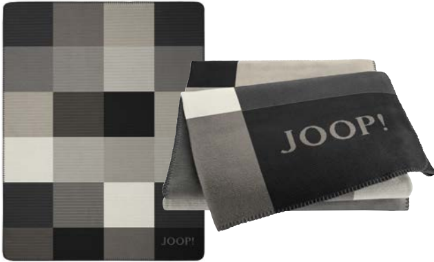
Schwarz-Natur Art.-Nr. 804594