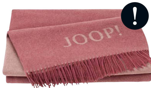
Rouge-Nude Art.-Nr. 804846