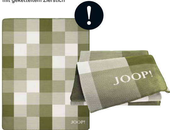
Grün Art.-Nr. 807496