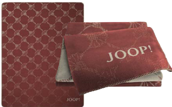
Rouge Art.-Nr. 804525