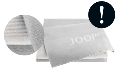
Stein-Silber Art.-Nr. 758736