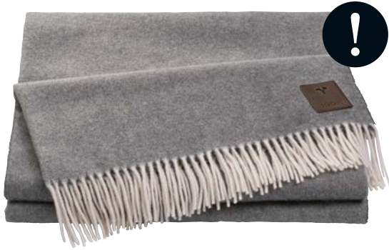
Graphit Art.-Nr. 746962