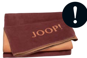
Granat-Kupfer Art.-Nr. 791146