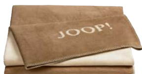
Cashew-Macchiato Art.-Nr. 739384