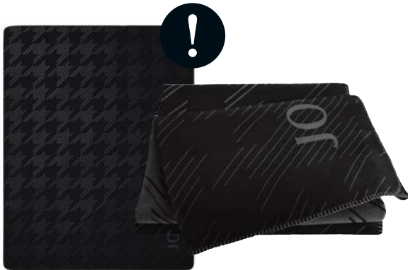
Schwarz Art.-Nr. 804549