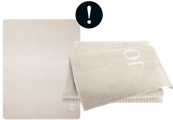
Creme Art.-Nr. 804563