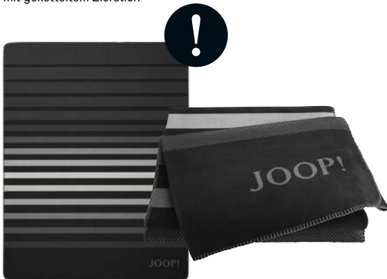
Schwarz Art.-Nr. 804648