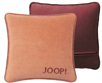
Kupfer-Granat Art.-Nr. 791214