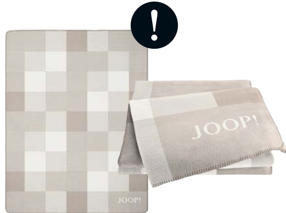
Natur Art.-Nr. 807502