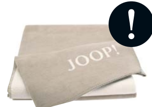
Sand-Pergament Art.-Nr. 564320