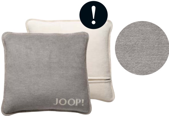
Silber-Natur Art.-Nr. 754646