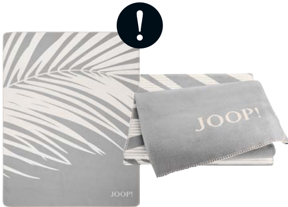
Stein Art.-Nr. 807489