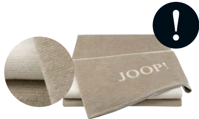
Sand-Natur Art.-Nr. 716330