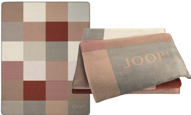
Rouge-Natur Art.-Nr. 804617