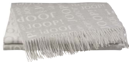
Silber Art.-Nr. 791276