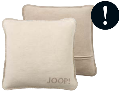
Pergament-Sand Art.-Nr. 651235