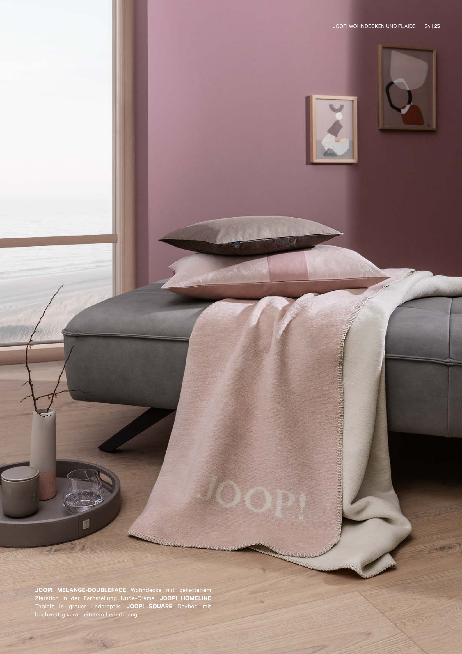
JOOP! MELANGE-DOUBLEFACE Wohndecke mit geketteltem Zierstich in der Farbstellung Nude-Creme. JOOP! HOMELINE Tablett in grauer Lederoptik. JOOP! SQUARE Daybed mit hochwertig verarbeitetem Lederbezug.