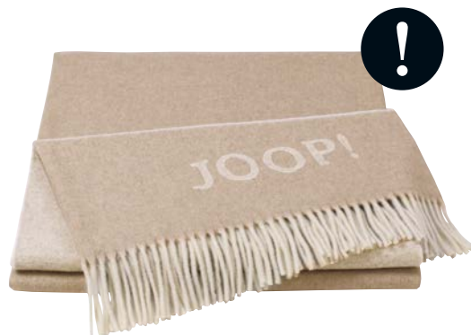
Creme-Natur Art.-Nr. 739841