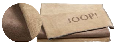
Cashew-Kastanie Art.-Nr. 739254