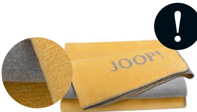
Gold-Silber Art.-Nr. 781871