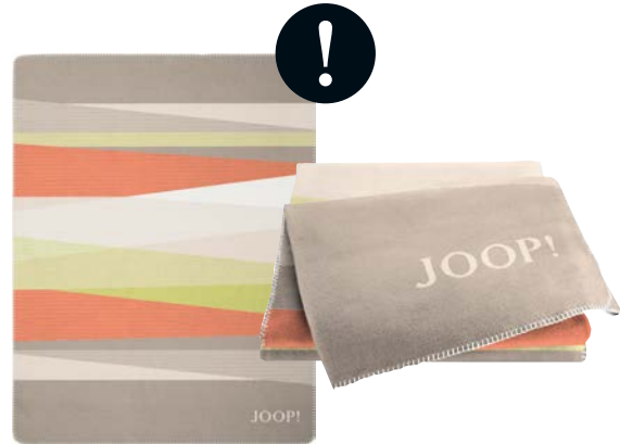
Melon Art.-Nr. 807540