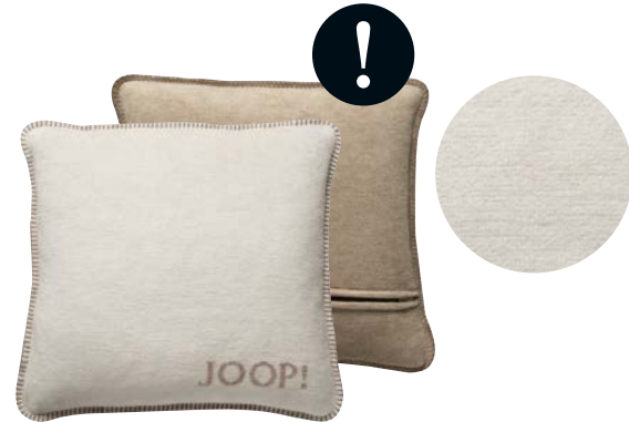
Natur-Sand Art.-Nr. 754660