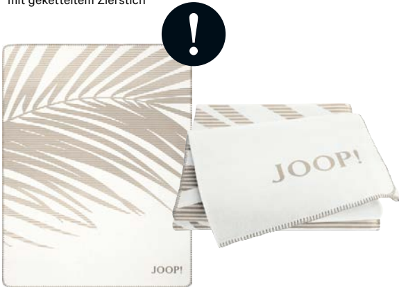
Creme Art.-Nr. 807465