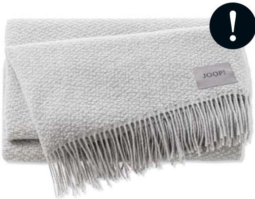
Silber Art.-Nr. 804853