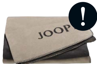
Stein-Anthrazit Art.-Nr. 781895