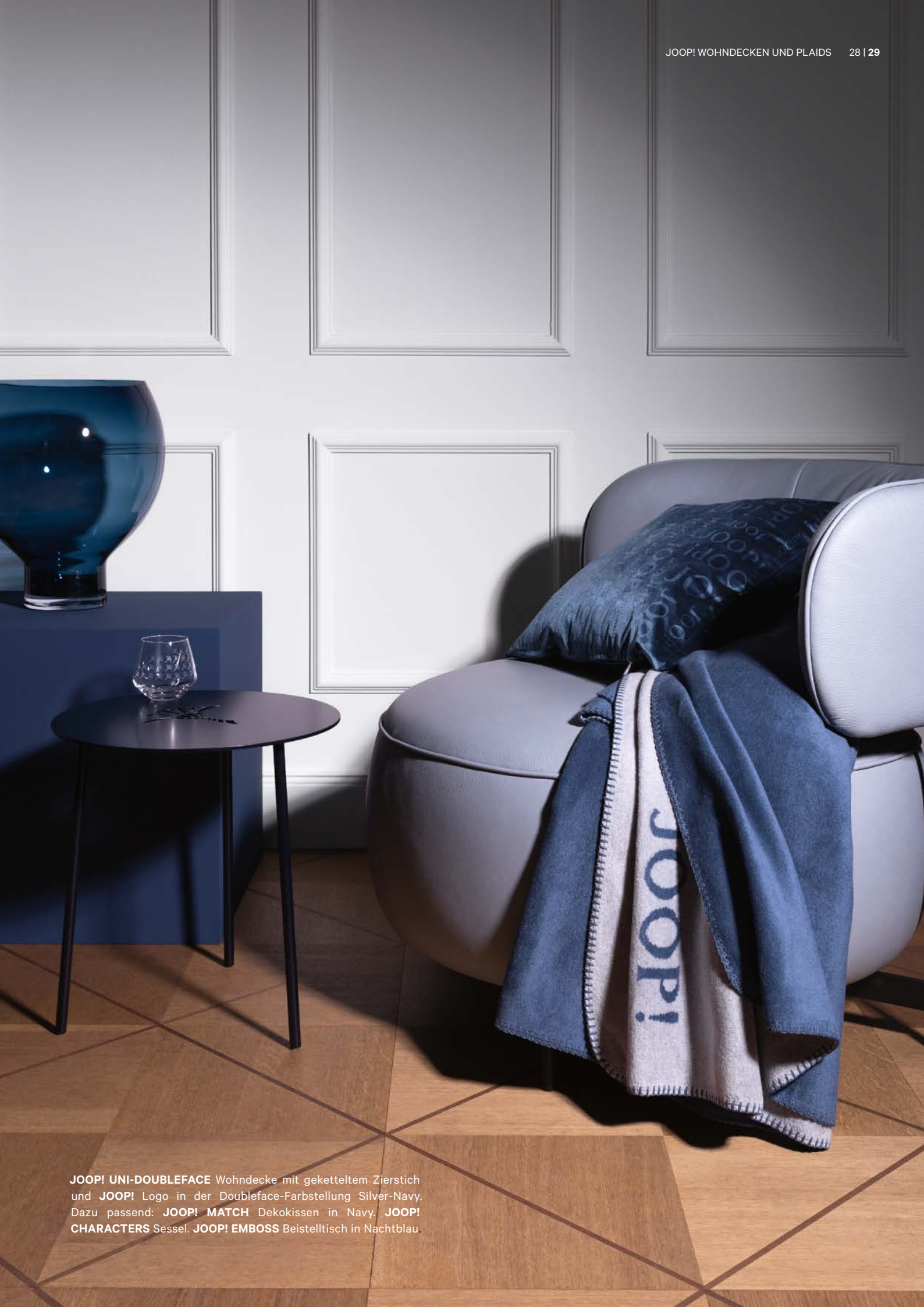
JOOP! UNI-DOUBLEFACE Wohndecke mit geketteltem Zierstich und JOOP! Logo in der Doubleface-Farbstellung Silver-Navy. Dazu passend: JOOP! MATCH Dekokissen in Navy. JOOP! CHARACTERS Sessel. JOOP! EMBOSS Beistelltisch in Nachtblau.