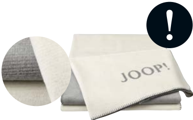
Natur-Silber Art.-Nr. 706232