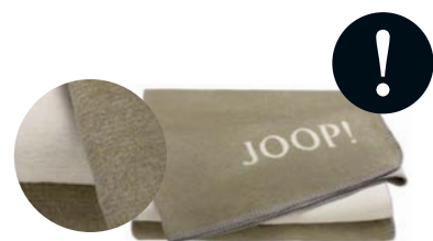
Oliv-Natur Art.-Nr. 781864