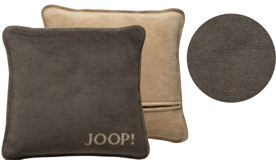
Kastanie-Cashew Art.-Nr. 754684