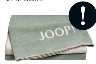
Jade-Silber Art.-Nr. 758781