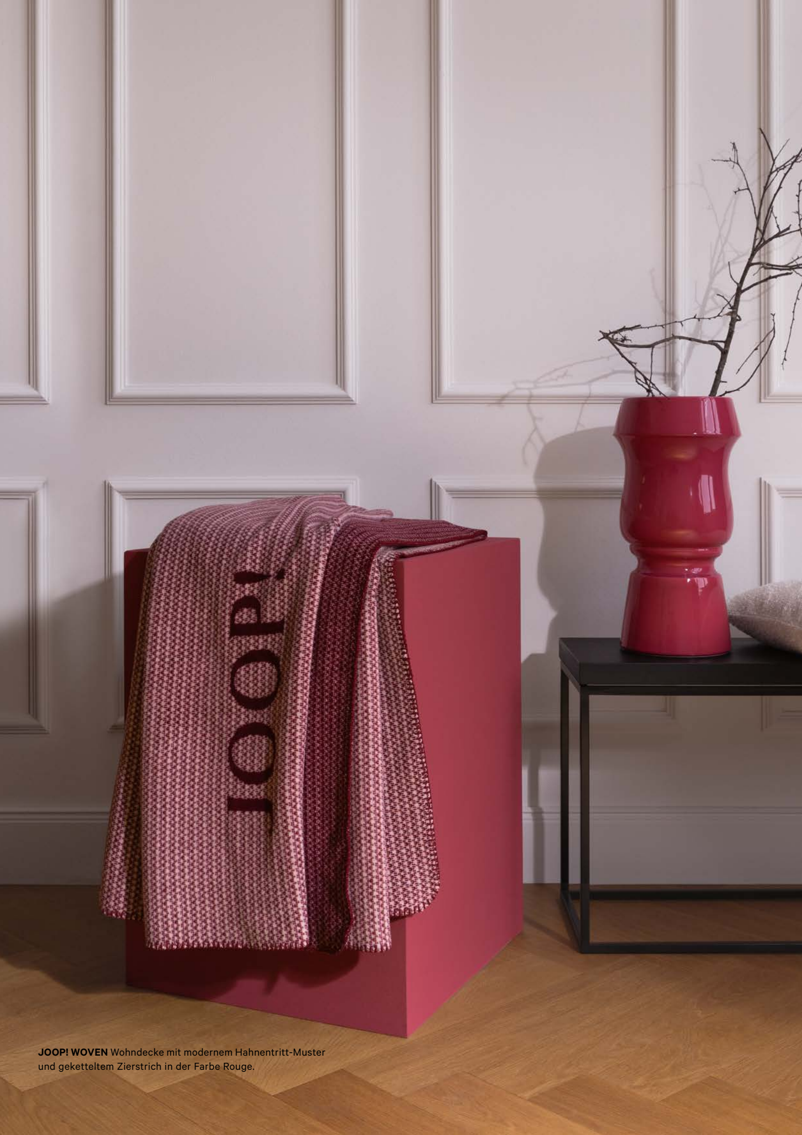
JOOP! WOVEN Wohndecke mit modernem Hahnentritt-Muster und geketteltem Zierstrich in der Farbe Rouge.