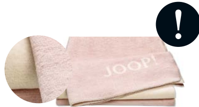
Nude-Creme Art.-Nr. 758729