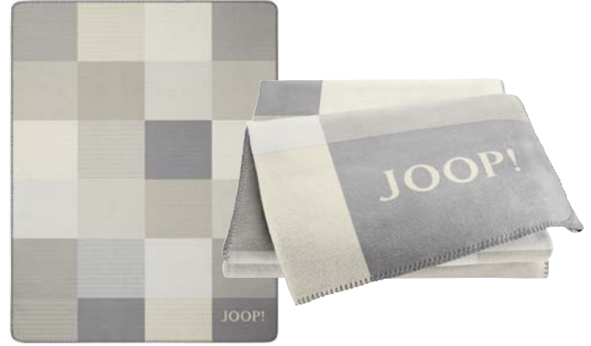
Chateau-Natur Art.-Nr. 804600