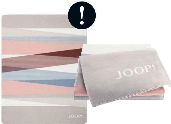
Pastel Art.-Nr. 807557