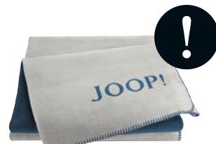
Silber-Navy Art.-Nr. 781888