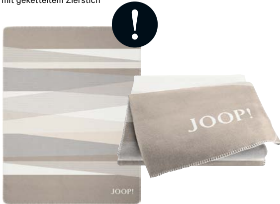
Natur Art.-Nr. 807533