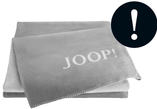
Graphit-Rauch Art.-Nr. 564382