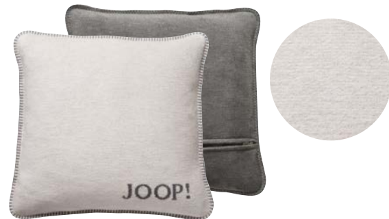
Ecrú-Graphit Art.-Nr. 754707