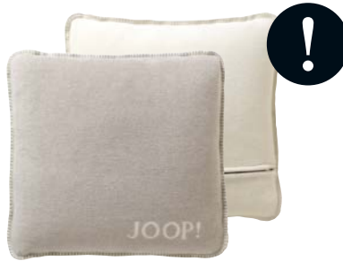
Feder-Ecru Art.-Nr. 693785