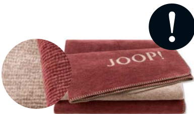
Rouge-Chateau Art.-Nr. 804655