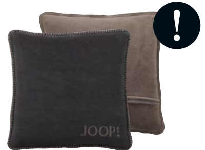
Anthrazit-Taupe Art.-Nr. 651273