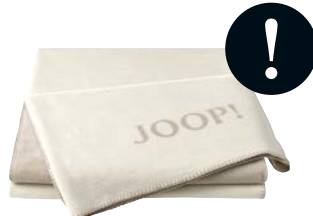
Ecru-Feder Art.-Nr. 693426