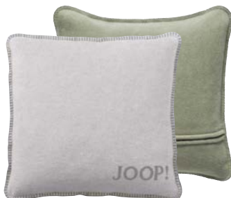
Silber-Jade Art.-Nr. 758958