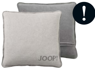
Rauch-Graphit Art.-Nr. 651280