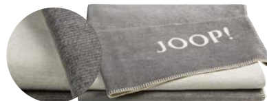
Graphit-Ecru Art.-Nr. 739223