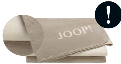
Stein-Natur Art.-Nr. 781857