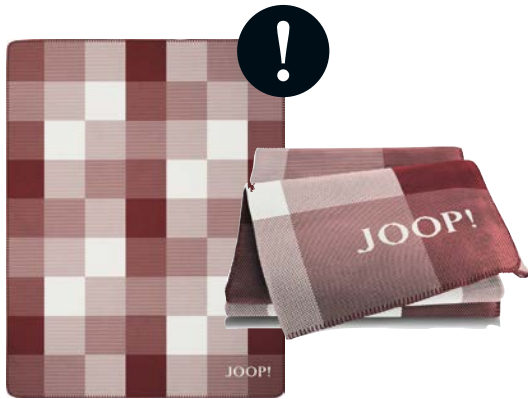
Blush Art.-Nr. 807519