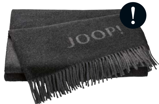
Anthrazit-Graphit Art.-Nr. 739827