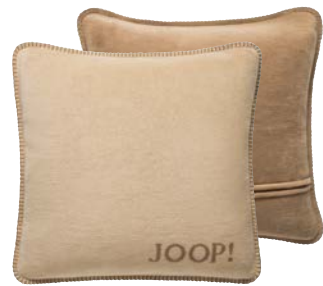
Macchiato-Cashew Art.-Nr. 739445