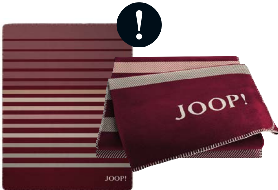
Rouge Art.-Nr. 804631