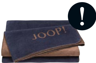
Marine-Karamell Art.-Nr. 769190