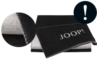
Anthrazit-Silber Art.-Nr. 706218