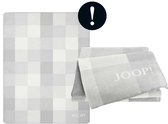
Grau Art.-Nr. 807526