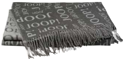
Anthrazit Art.-Nr. 791269