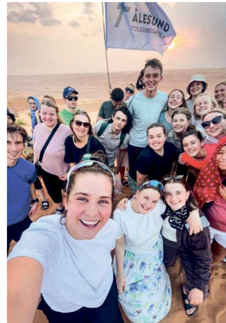
Frå turen som gjekk til Oman, då Israel ikkje var tilgjengeleg.

Skuleåret 2023-2024 ved Ålesund folkehøgskole har vore eit år fylt med minnerike opplevingar og sterkt samhald.