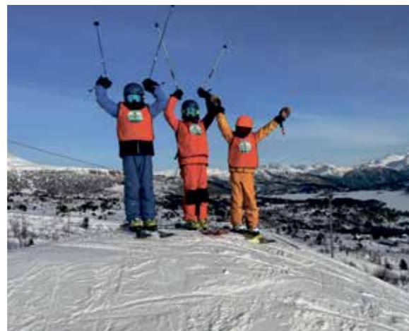
Flotte vinterleker på Orreneset

-Ingen grunn til å klage, vi er på vinnerlaget. Selv om vi strever her nede, venter en evig glede, hos ham som vant en gang for alle. Seieren har vi i troen på ham. Vi er på vinnerlaget.