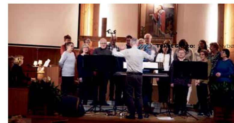
Koret Sanctus frå Spjelkavik bedehus var med på avslutningsmøtet for felles-samlingane i Sula, som har vore arrangert i 20 år.