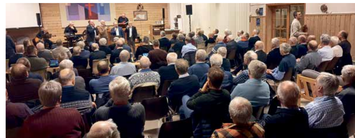
Fullsett sal på Brusdalsheimen og Valderøykvartetten på podiet

Ho er knytt til Fiskarstrand Indremisjon, der det blei sett eit verdig punktum for felles-samlingane søndag 28. januar. Då hadde det vore samlingar kvar dag på ulike stader sidan onsdagen før. Salen var fullsett, då krinsleiar