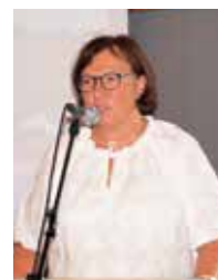
Tekst & foto: Anbjørg Bårnes

Nå venter vi igjen på den store Kongen i det lille Barnet. Måtte vi alle følge stjernen frem til vi får se Jesus som vår - Underfull Rådgiver, Veldig Gud og Fredsfyrste.