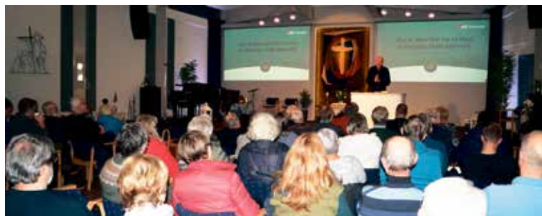
Fullsett sal under Bibelkurs på Blindheim bedehus.