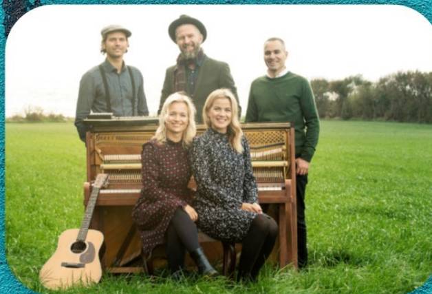
Sang av Øklands