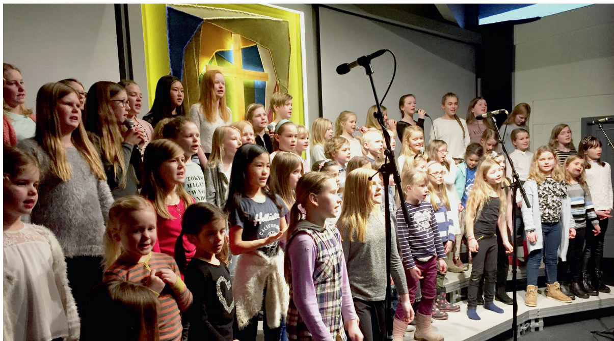
Koret i aksjon.