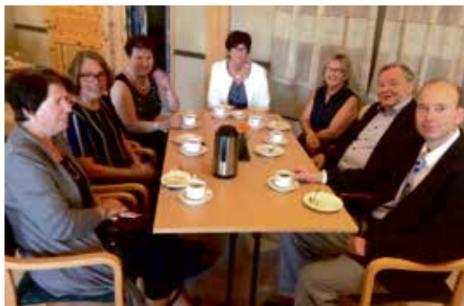
God stemning rundt kaffibordet.