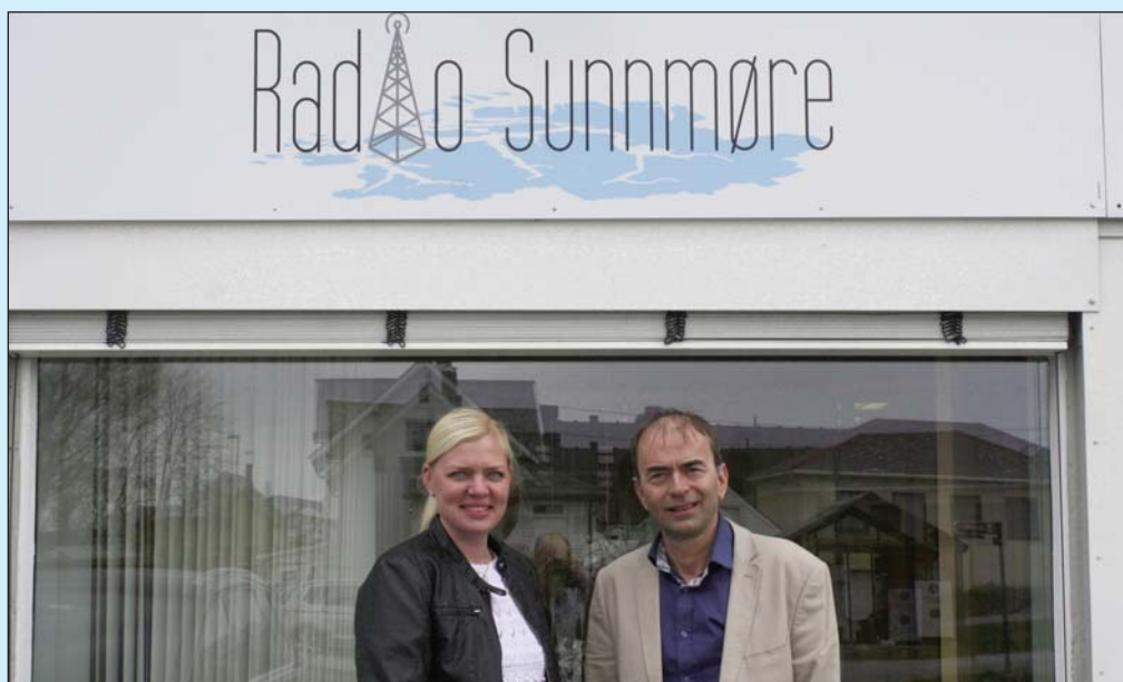
Radio Sunnmøre har i dag to heile stillingar, som sender 73 timar i veka over heile Sunnmøre.