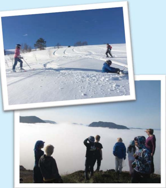
Glimt frå fjelltur og skidag