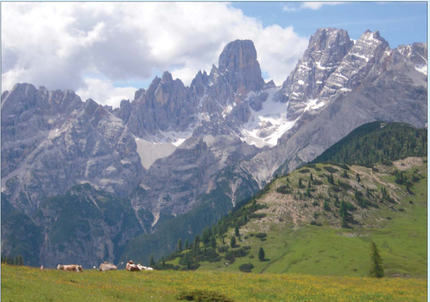
Vandretur i Dolomittene er et av våre turtilbud.