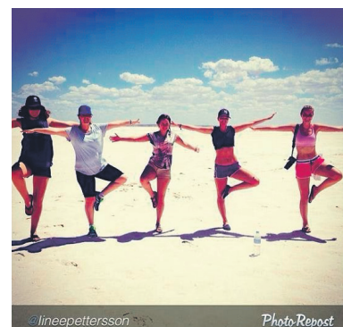
Bileta er frå #borgfhs på Instragram.