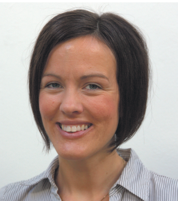
Det var mykje morro då familiane samlast på leir.

I midten av august byrja eg i nyoppretta, halv stilling som områdeleiar for Åpne Dører på Sunnmøre.