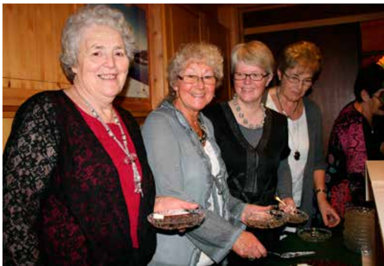
UT PÅ TUR: Denne gjengen var til Israel med Radio Sentrum.

TEKST: TURID NORDSTRAND RØDSET