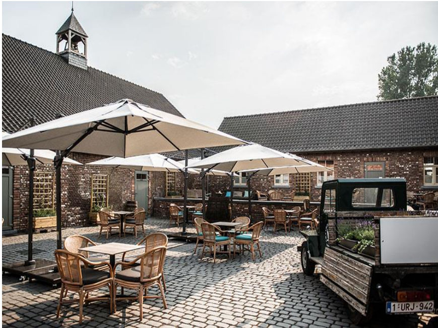
Het terras van Craeywinckelhof

Aansluitend brunch voor wandelaars en niet wandelaars aan een stuntsprijs (Niet vóór 10 uur)