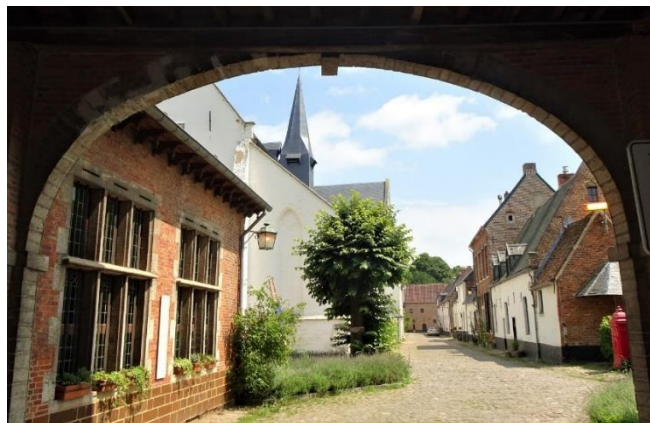
Het Begijnhof van Diest

Je kan deelnemen aan deze leerrijke en leuke uitstap door storting van 40 euro per persoon op onze SKL rekening BE78 4310 0665 6186 met vermelding van code 733. Voor deze prijs krijg je een zitje op de bus, een geleid bezoek aan het Moment