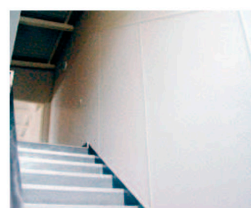
Skoler &amp; institutioner