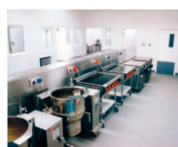
Storkøkkener, hospitaler &amp; laboratorier