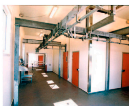
Anden industri &amp; landbrugsektoren