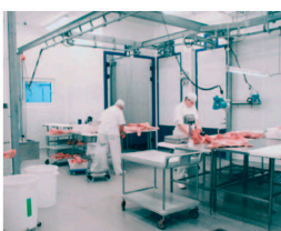
Fødevarer- &amp; levnedsmiddelindustrien