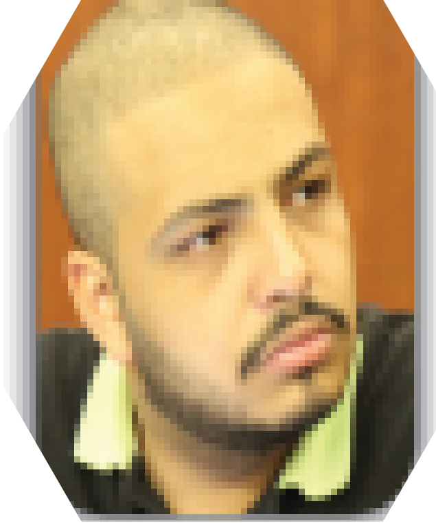
أ. اسلام العزيز مواقع التواصل الاجتماعي