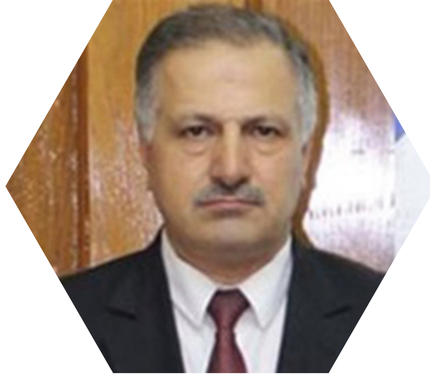
أ.د طارق الجنابي

وزير الشؤون الإفريقية في البرلمان الدولي