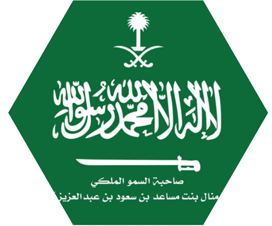
صاحبة السمو الملكي الأميرة منال بنت مساعد آل سعود رئيس مجلس الإدارة