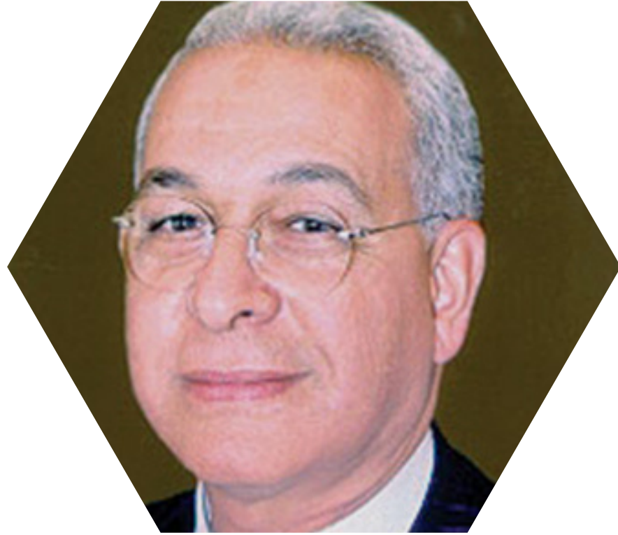
أ.د هاني هلال وزير البحث العلمي الأسبق