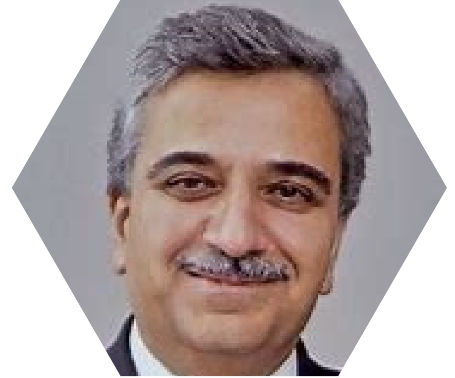
أ.د محمد أبو حمور

وزير الشؤون الإفريقية في البرلمان الدولي