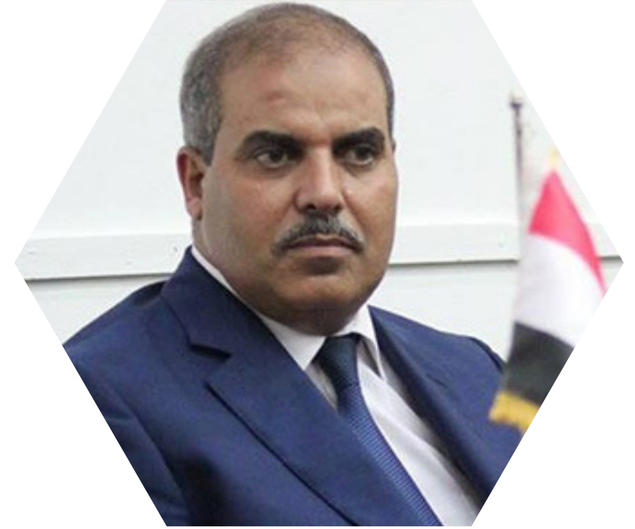
أ.د محمد المحرصاوي رئيس جامعة الأزهر