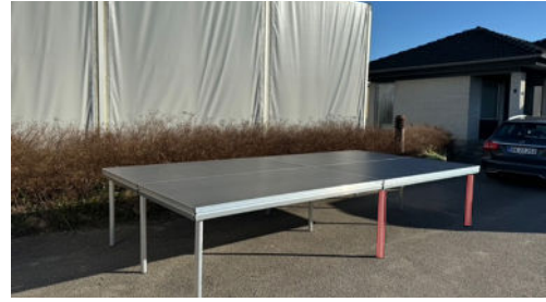
Alle podier yderst til højre har 2 ben (røde).