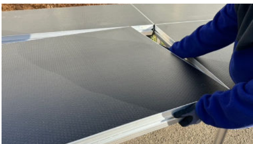
Alle andre podier – her sættes podiet skråt på.