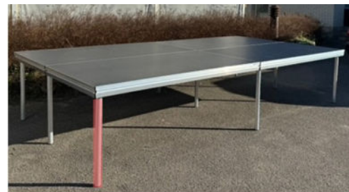
Alle andre podier skal kun have 1 ben (rødt).