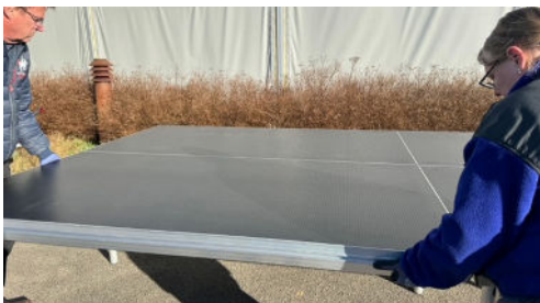
Skub podiet på plads, så det "slider" ind.