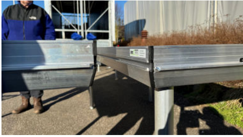
2. podie i højre side hægtes ind – det har 2 ben på.