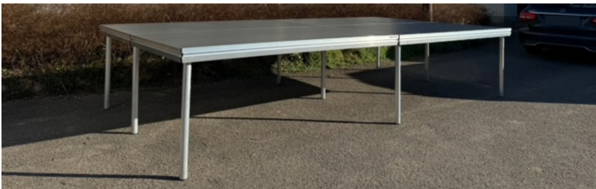
Sådan ser den færdige scene på 4x2 m ud.