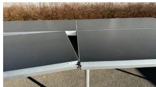
Hansiderne hviler på hunsiderne i en trekant.