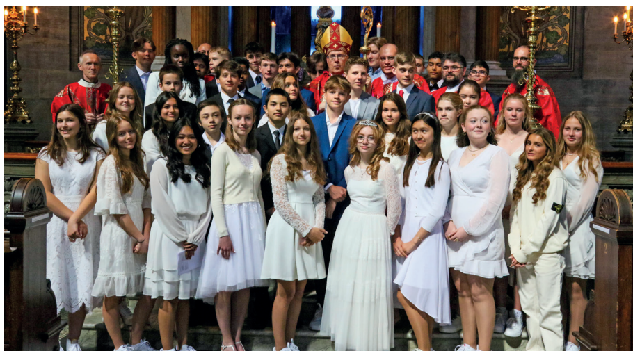
De glade firmander i Marmorkirken fra Sct. Ansgars, Jesu Hjerter og Sakramentskirken lørdag d. 4. juni med Biskoppen og deres præster

For kommende førstekommunikanter er der informationsmøde og indskrivning mandag d. 15. august kl. 19:00 i menighedssalen, Bredgade 69A. Kun for forældre, som bedes medbringe kuglepen og en kopi af barnets dåbsattest.