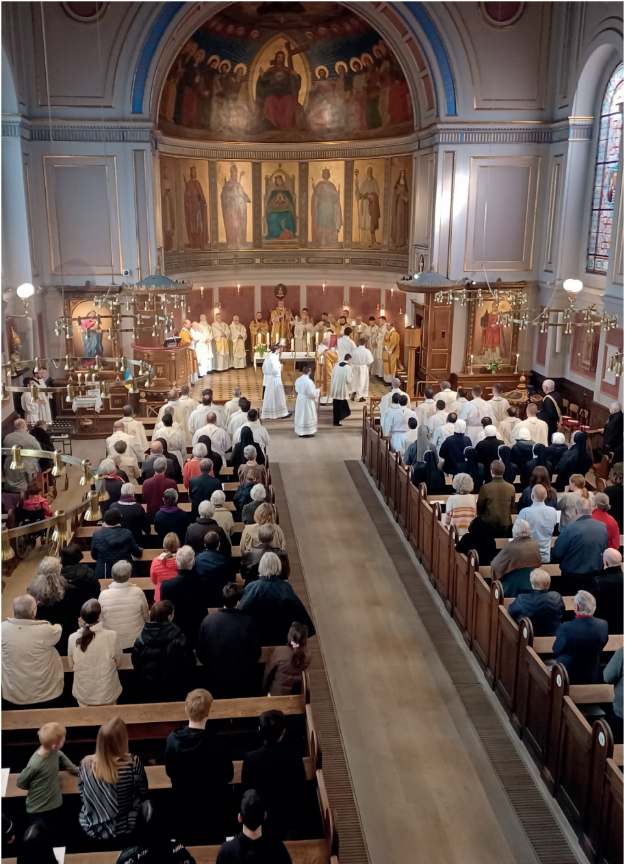
Endelig Oliemesse igen i Sct. Ansgars efter 2 år med Corona. Hvor er det dejligt!