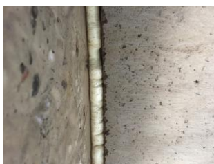
Tätning av betonglock i vattenbrunn nr 2 vid Centrumhuset.