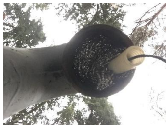
Skyddsnet i ventilationsrör vid vattenbrunn nr 1.