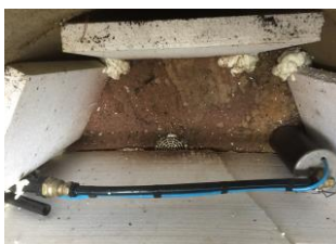
Vattenbrunn nr 2 vid Centrumhuset.