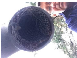
Skyddsnet i ventilationsrör vid vattenbrunn nr 2 vid Centrumhuset.

Punkt 1 i SRMH:s föreläggande om åtgärder