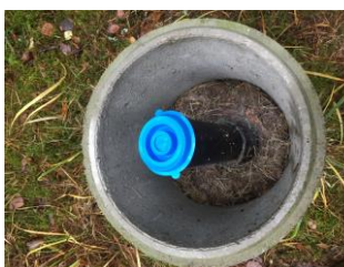
Skyddslock på grundvattenrör placerat under betonglock.