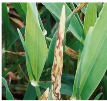
Billede 2. Skoldplet.