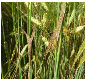
Billede 4. Angreb af ramularia.

kr./hkg, og i år er der en del svampeangreb i flere sorter. Netop ved stakkens fremkomst opnås samtidig den bedste forebyggelse af eventuelle senere angreb af ramularia. Risikoen for angreb af ramularia øges ved bladfugt, og hvis planterne er/har været stressede i foråret. Det er vanskeligt at forudsige, hvilke år ramularia for alvor indtræder, men sygdommen koster store udbyttetab ved angreb.