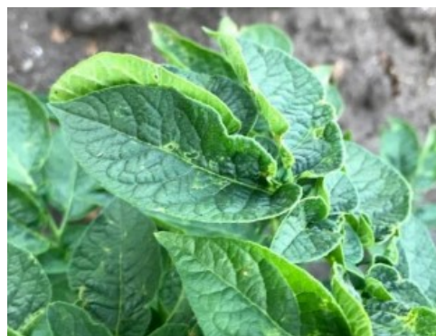
Billede 1. Angreb af tæger ses ved huller og krusninger i bladene. Kilde AKK.

I registreringsnettet blev der i uge 20 fundet en relativ høj indflyvning, som dog faldt lidt i uge 21. Der er konstateret cikader på alle 23 registreringslokaliteter. Evt. bekæmpelse er aktuel cirka 3 uger efter begyndende indflyvning, forudsat at der er tilstrækkelig med bladmasse.