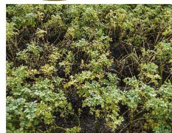
For tidlig nedvisning pga. cikader