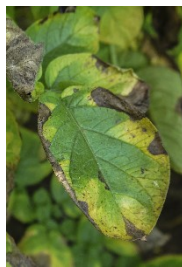
Symptomer på sugning af cikadenymfer