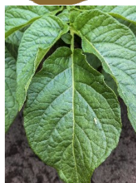
Indflyvning af cikader