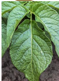
Indflyvning af cikader