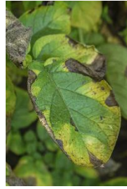
Symptomer på sugning af cikadenymfer