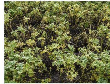
For tidlig nedvisning pga. cikader