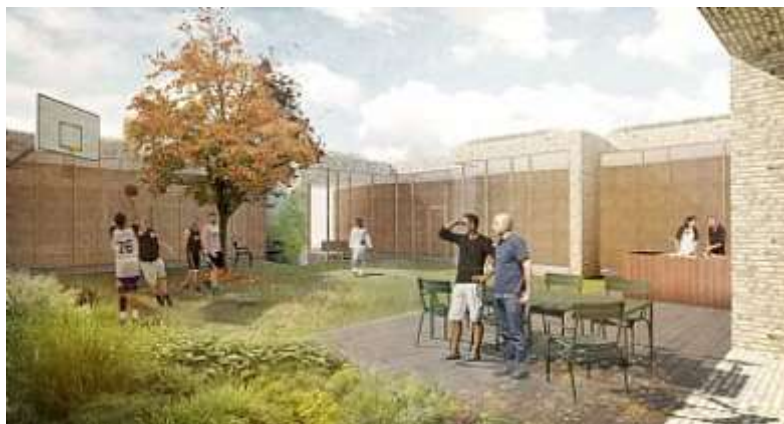
Animation af det nye retspsykiatri-center i Roskilde