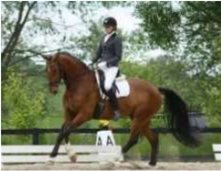
Fra "Rideklubben Hundested"

ejende institution. Visionspuljen på 200.000 kr. fik 25 ansøgninger. Lokalrådene er fortsat i god dialog.