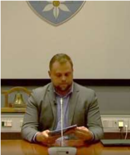
Borgmesteren fremlægger budgetforslaget