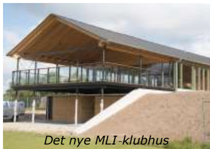
Det nye MLI-klubhus

Melby Klubhus er færdigt, men blev noget dyrere end beregnet. Vi har afsat en ny pulje til idrætsinvesteringer.