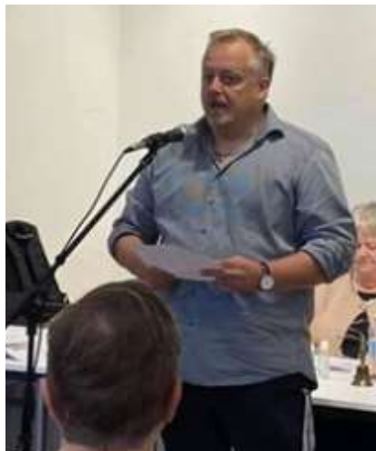
Jeg takker for valget

Til sidst er der bare at sige mange tak til generalforsamlingen for at vælge mig som foreningens nye formand. Det er en stor ære at få lov at træde ind på posten. Jeg ser det som en kæmpe tillidserklæring fra jer.