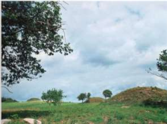
Bronzealderhøje på Arrenæs