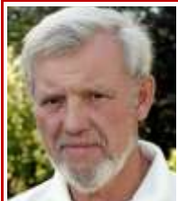
Drømmen om Europas fremtid s. 6-7