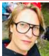
Formandens beretning s. 4-5