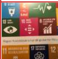
Regionen s. 8-9