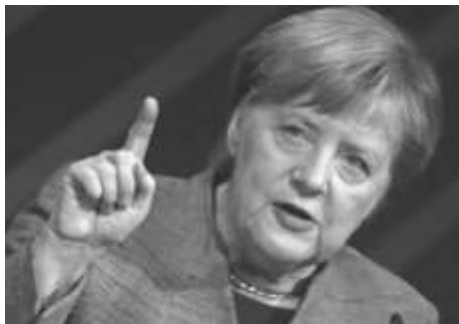
Angela Merkel viste engagement ved sit besøg i EU

Løkke-regeringen bryster sig af at være den grønneste regering i mands minde. Det er den ikke, men den kan da gå foran og kæmpe for lastbilernes reduktionsmål ved at støtte Europa-Parlamentets position.