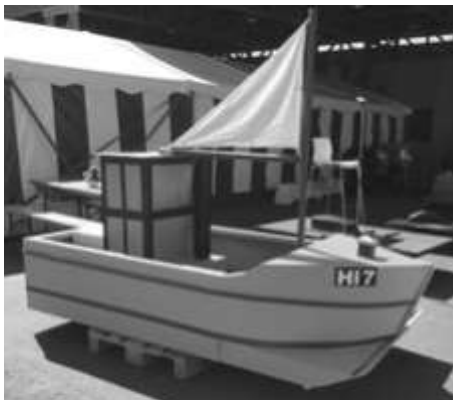
Sliskeræs-båden MÅGEN i juli