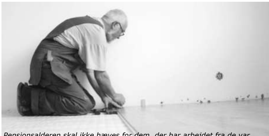
Pensionsalderen skal ikke hæves for dem, der har arbejdet fra de var teenager (arkivfoto)

Det bør altid være et mål i Danmark, at man kan gå på pension i god tid før man er nedslidt og udbændt, så man får nogle gode år i den tredje alder. Men i den politiske debat om pensionsalder glemmes det vigtige formål desværre ofte.