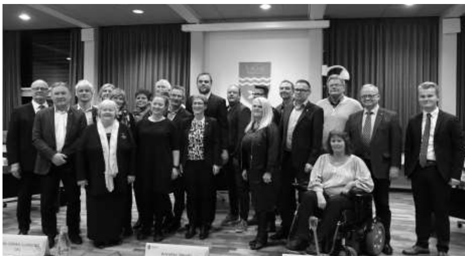
Hele byrådet klar til fire år i arbejdstøjet. Den socialdemokratiske gruppe besætter som bekendt 10 ud af 21 pladser

Og tak til alle jer gæve socialdemokrater for, at I hjalp os til at få et stærkt hold i byrådsalen - det er afgørende også i en periode, hvor vi skal lave reduktioner, da det er i de perioder, hvor vi også skal kæmpe for, at de sårbare ikke rammes unødigt.