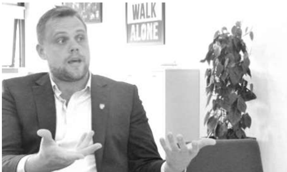
Svære budgetforhandlinger med kommunens pressede økonomi som omdrejningspunkt forestår

ringsudgifter til sundhedsvæsenet. I 2017 blev kommunen underkompenseret med 15 mio. kr., men situationen forventes forværret fra 2018 som følge af de nye afregningsregler, der særligt rammer kommuner som Halsnæs, der har mange sårbare børn og flere ældre end en gennemsnitlig kommune.