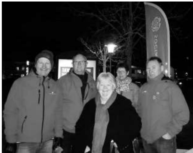
Der var både røde jakker, røde næser og godt humør ved valgkampens gademøder

med valgkamp og overvejelser om, hvad der skulle til for at blive valgt. Jeg deltog i stort set alle de kampagnedage, som vi havde. Der var mange kolde og våde dage. Der var isende morgener på stationerne inden arbejde. Det var til tider hårde lange dage, men hele vejen igennem var det båret af et kammeratskab med de andre kandidater, men også af de mange frivillige, der støttede os i valgkampen. For mig som ny gav det nye venskaber og politisk læring, når jeg stod derude med de mere drevne partifæller, men min lyst til at deltage steg fra dag til dag.