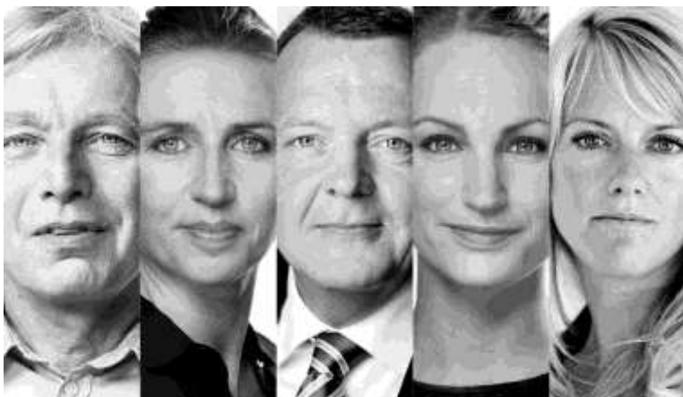
Statsministeremnerne med våde drømme: Uffe Elbæk, Mette Frederiksen, Lars Løkke Rasmussen, Pernille Skipper og Lars Pernille Vermund (arkivfoto)