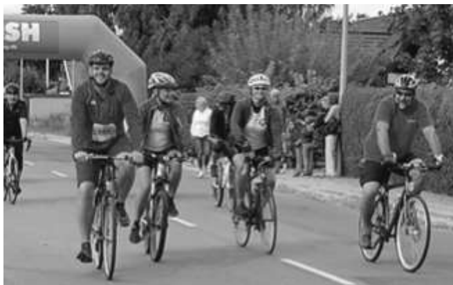
Med borgmesteren Arresø Rundt (arkivfoto)