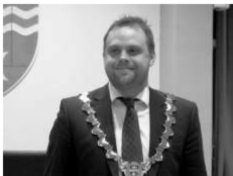
Den generobrede borgmesterpost

Glæden over at være kommet ind - og erobringen af borgmesterposten boblede inden i, og samtidig var det vemodigt at se de kammerater, som havde kæmpet for en plads i byrådet, blive sendt hjem med en tak for indsatsen. En dobbelt følelse som jeg aldrig før har været i.