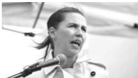
Godt at se Mette på banen igen

godt glemme deres våde drømme om den post, og vi andre kan godt glemme, at de nogensinde har været politiske topfigurer. Og så er der ham Thulesen Dahl, der vil samarbejde med Socialdemokraterne, men vil stemme på Lars Løkke som statsminister? Er det det, der hedder "blæse og have mel i munden", eller "ride på to heste på en gang". Hvor længe tror, han den går, den fidus? I min terminologi er det sådan én, man kalder en uvederhæftig person. Men den slags trives jo i politik. Pressen er også godt i gang med at køre småsvindleren Messerschmidt i stilling med billeder og alt, så han igen kan begynde at manipulere med EU's midler. Ok, han er en dygtig taler og politiker, men ingen er da så dygtige, at de kan tillade sig at svindle. Jeg plejer at sige om den slags: Han får i alle tilfælde ikke lov at låne min cykel.