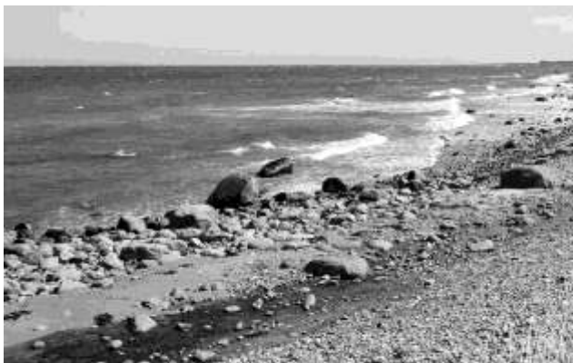
Stenet strand ved Nordmarken på Læsø

Jeg står fortsat fast på beskyttelse af kysten.