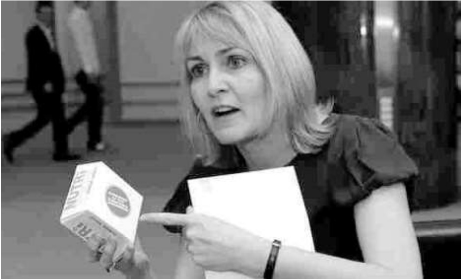
Christel Schaldemose i EU

Af Christel Schaldemose, medlem af Europa-Parlamentet