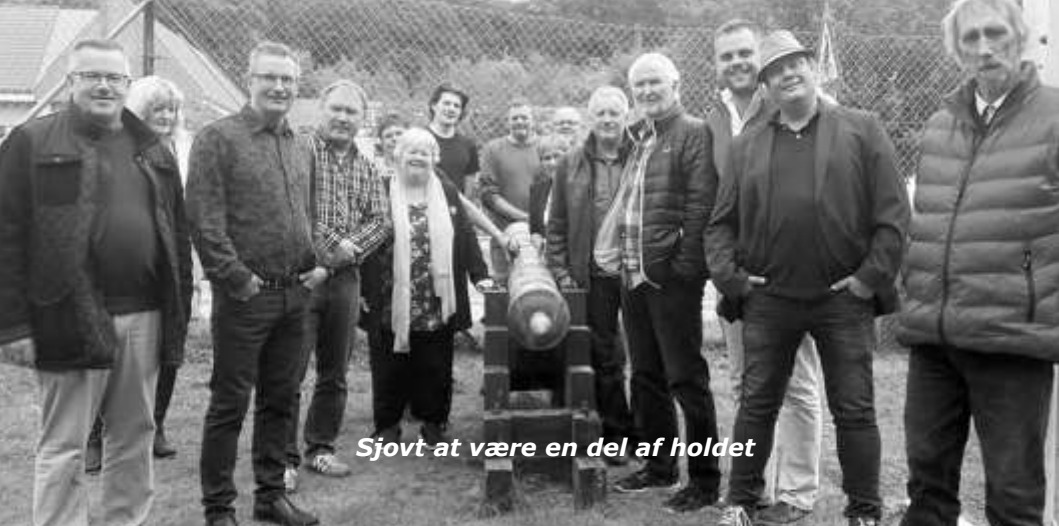
Sjovt at være en del af holdet