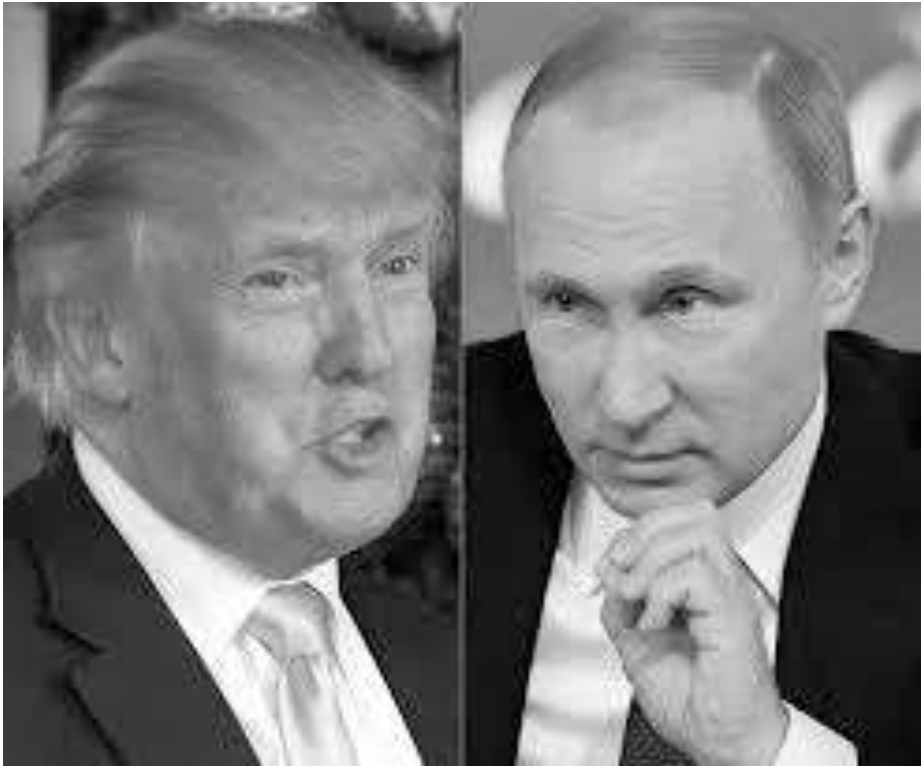
Et par farlige herrer fra hhv. vest og øst