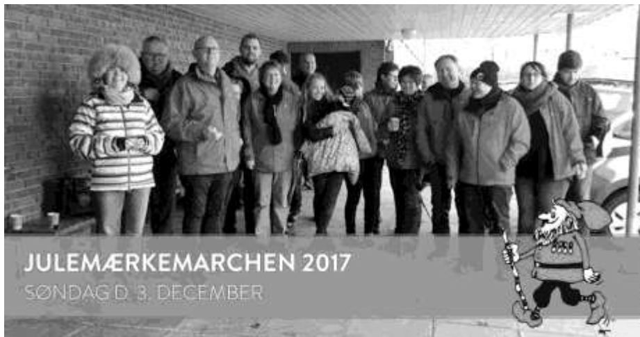
Det meste af holdet til Julemærkemarch