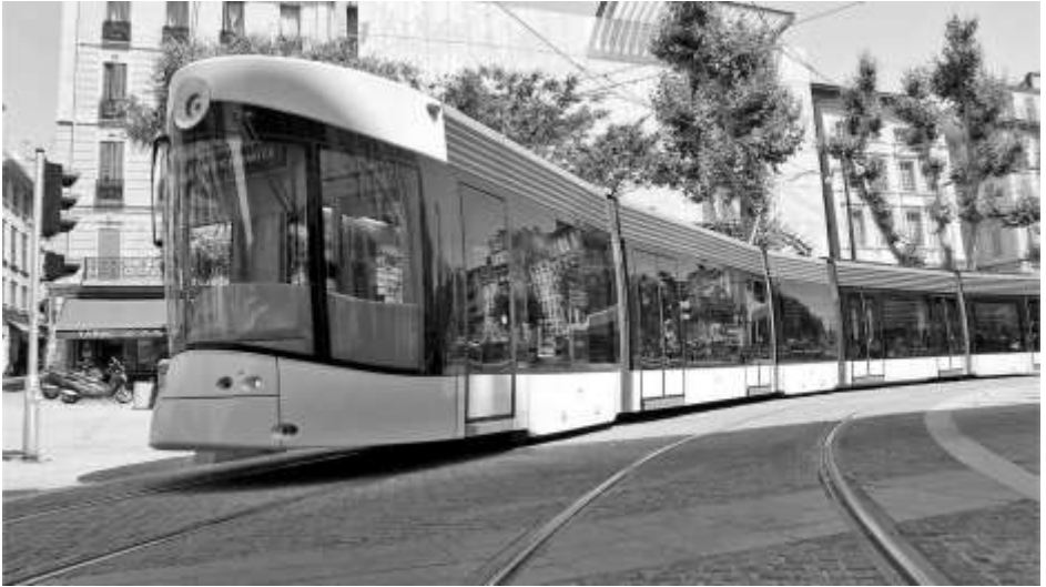
Drømmescenarie i København, men det skal ikke gå ud over yderområderne - fx Halsnæs

ket sag og et møde i rådet med førstebehandling af forretningsordenen for det nye råd er det blevet til.