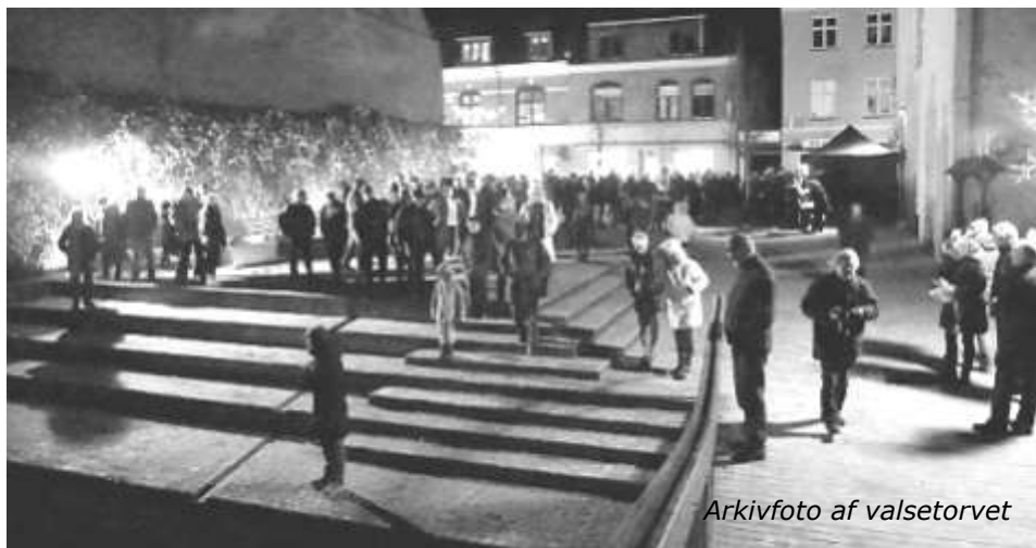
Arkivfoto af valsetorvet