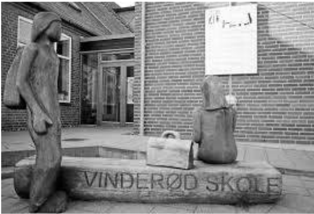
Den lille velfungerende kommuneskole i Vinderød 2014 er nu blevet til en lille privatskole

re stod i kø for at rose projektet. Godt med en lille skole, helt klart økonomisk bæredygtig og ingen tvivl om, at det ville øge fagligheden. I Socialdemokratiet kan vi godt forstå forældrenes frustration og dermed oprettelsen af privatskolen, men det var slet ikke nødvendigt at privatisere Vinderød Skole, for den fungerer de rigtig godt i forvejen.