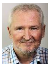
Torben skriver om værdighedspolitik Se s. 14-15