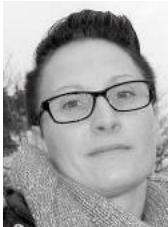
Den nye parti-formand siger tak Se s. 7