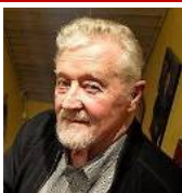
Tanker om magt, had og ekstremisme Se s. 10-11