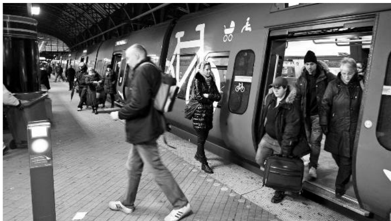
Regionen står for en analyse af den kollektive trafik

Tak til alle for opbakning i årets løb og for gode politiske debatter. Det har været en fornøjelse.