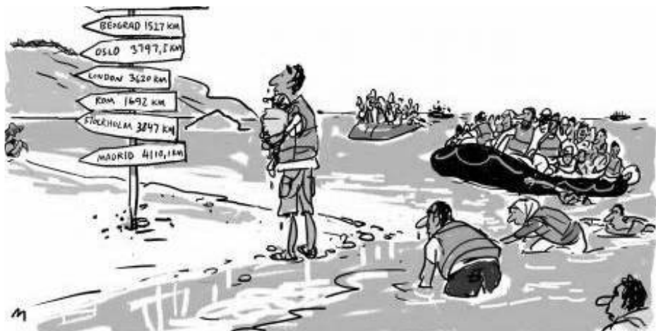
Det er ikke en turistrejse at flygte

des partisoldater og andre sympatisører.