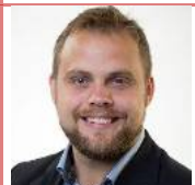
Steffen skr- iver om inte- gration og finansiering Se s. 7