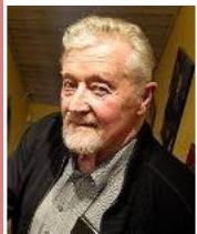
Folk, der har det godt, flyg- ter ikke s. 8-9