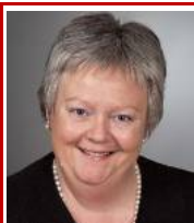
Gimle Se s. 10-11