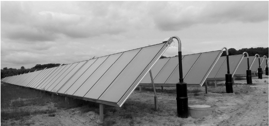
Solen har givet varmt vand til godt 1.300 husstande i Hundested i de sidste to måneder

Den anke, som Danmarks Naturfredningsforening i Halsnæs har fremført ved forhåndshøringen, var dels størrelsen på anlægget, dels den nære placering til et sommerhusområde samt en opfordring til, at der laves beplantning rundt om anlægget for at skærme for indsigt. Disse