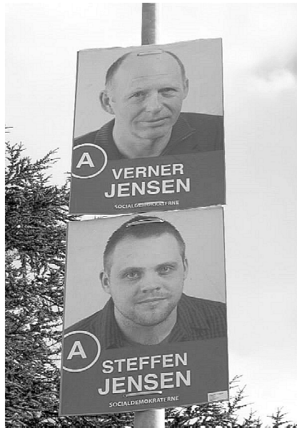
Kandidaterne oppe i lygtepælene - her far og søn

Vi er gået med i den nye konstituering, så vi kan få så meget ind-