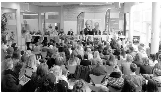
Valgmøde i gymnasiet

I år var det første gang at kandidaterne