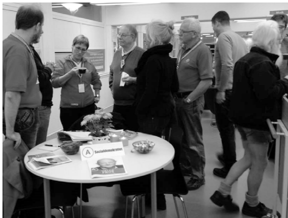
Cafe-møde på Frederiksværk bibliotek

valgmøderne. Og ved valgmødet på Frederiksværk gymnasium.