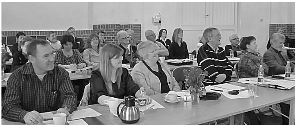
Et udsnit af deltagerne ved Strategikonferencen