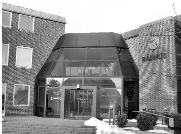
Det gamle rådhus i Hundested indrettes til bibliotek