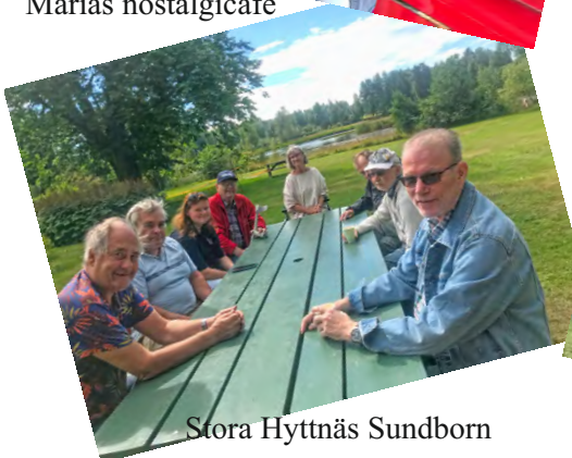
Stora Hyttnäs Sundborn