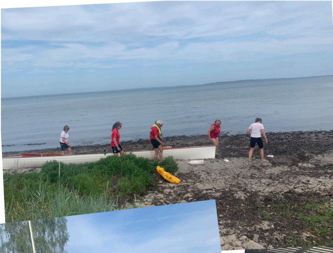
Fotos fra rochefernes tur til Nivå. Stranden i Nivå, Vintid, Pause-stop og madpakkespisning.