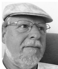
Materieforvalter Arne Lund