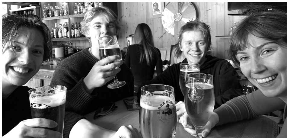
Kampklare danske vikinger fra Skjold leder efter bunden i bøgeret.