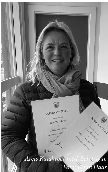
Årets Kajakroer med Sølvpagaj.

Nu ved jeg ikke helt hvad der skal til for at kvalificere sig til det – men tænker det er noget med at yde noget særligt for klubben, det sociale eller noget i den dur. Og jo, jeg har været meget i klubben – men mest for at ro, og jo, jeg stod for indkøb til vores tur til Stubbekøbing, og jo, jeg har repareret lidt på kajakerne – men mest af alt er det blevet til at have styr på alt det, der skal fikses, og jo jeg pakkede alt udstyr ned da sæsonen sluttede – og så har jeg været så heldig at få lov til at ro en havkajak til Nivå – og har boet der et par omgange, hvor jeg har slået græs og vasket mug af væggene – men altså det meste har jo bare været hyggeligt og alt for lidt i forhold til, hvad jeg egentlig synes, jeg burde gøre – og ikke mindst