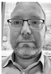
Kajakchef Steffen Lundstrøm

Rosæsonen 2023 er overstået, og forhåbentlig deltager alle nu aktivt i nogle af de mange vinteraktiviteter, som Skjold tilbyder.