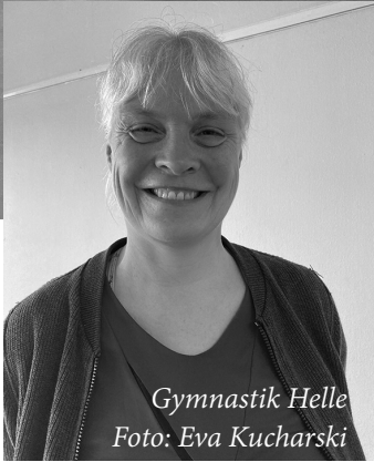
Gymnastik Helle