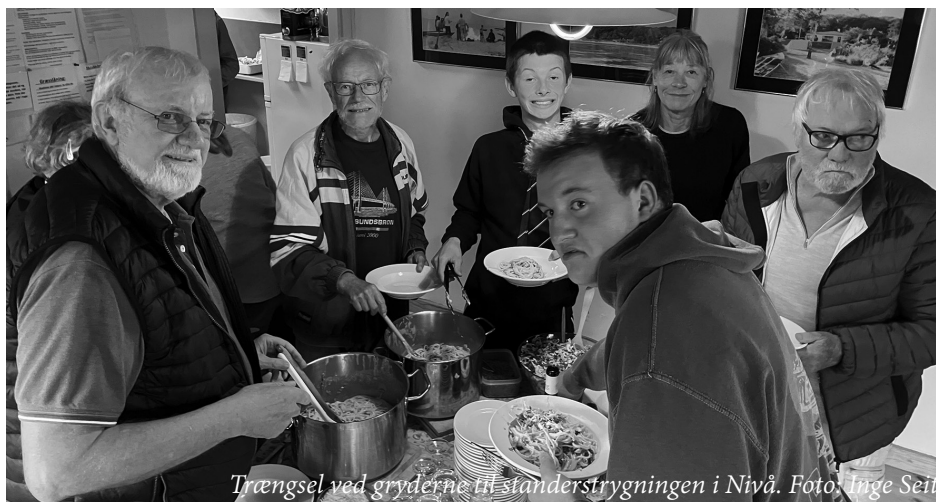
Trængsel ved gryderne til standerstrygningen i Nivå.

(mod tilmelding). De tre ungdomsroere Ask, Simon og Elias roede derop - mens andre aktive skjoldere også fandt derop men ad landevejen frem for vandvejen. Som det fremgår af Inges foto fra dagen, var det et rigtigt hyggeligt og vellykket arrangement.