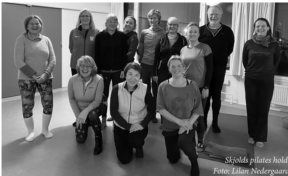
Skjolds pilates hold.