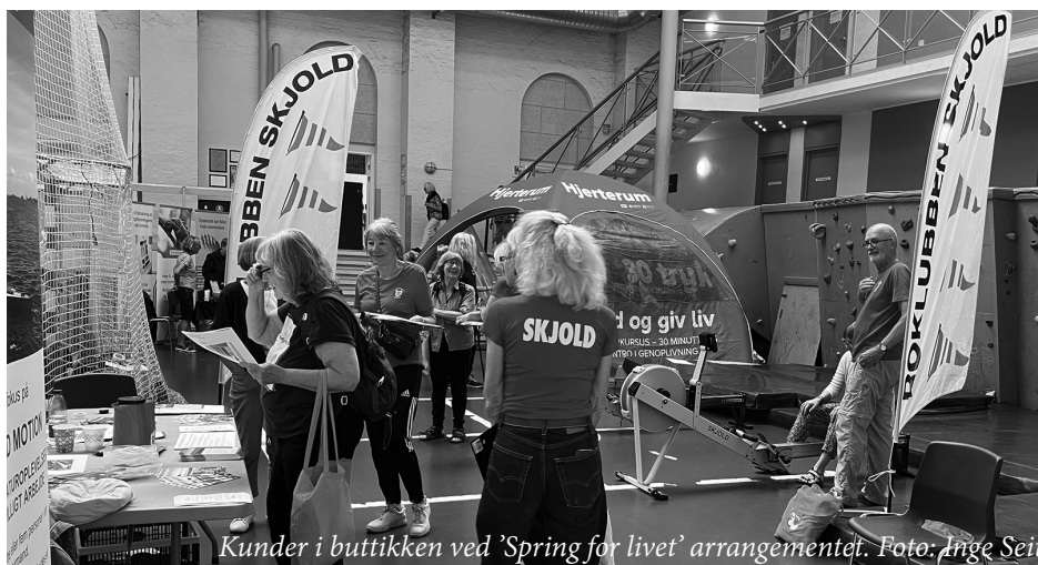
Kunder i butikken ved 'Spring for livet' arrangementet.