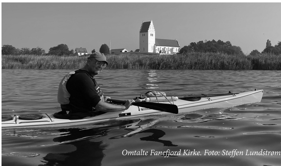
Omtalte Fanebjerg Kirke.

Stubbekøbing. Kulinarisk havde byen ikke meget at byde på, men der ligger en Netto lige ved siden af klubhuset, og vi havde fået lov til at låne deres gasgrill.