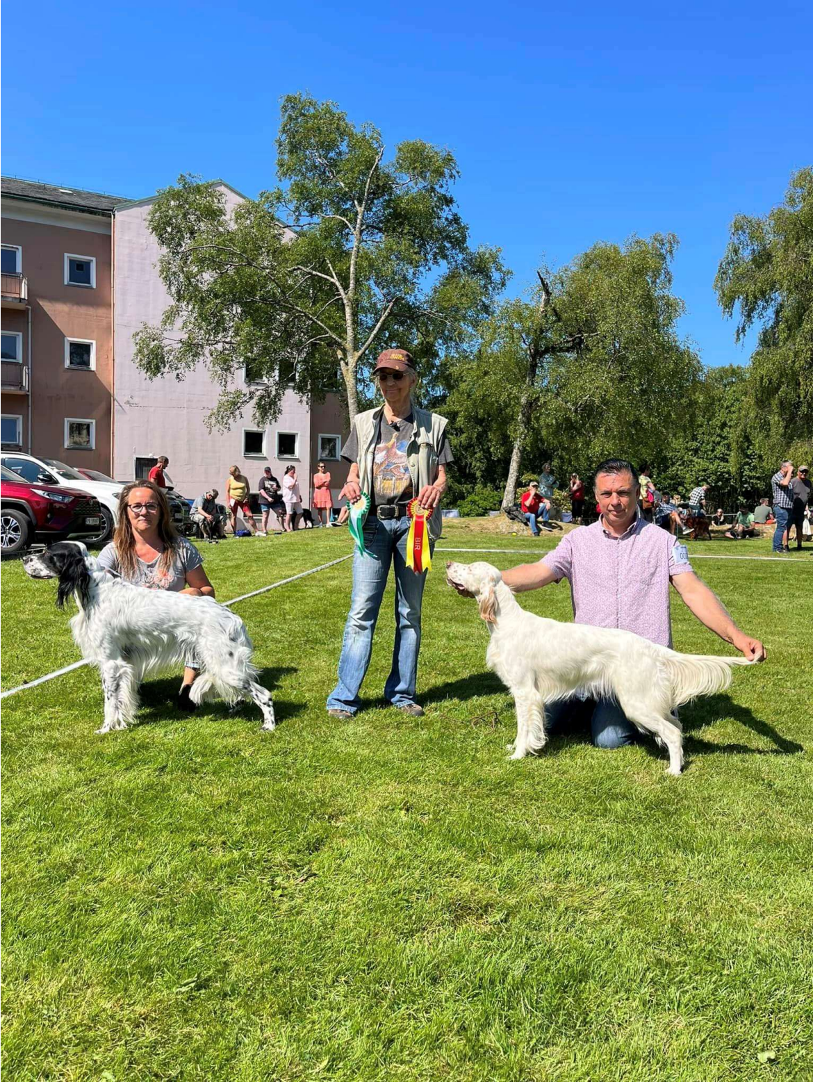
BIR Langvassåsens Varja