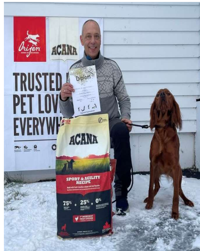
Håland og VB Seek To Find som klarte 1AK fuglearbeid,

Alle hundene hadde flere sjanser på fugl. Det kokte med fugl i terrengene. En flott helg med en særdeles dyktig prøve-komitee.