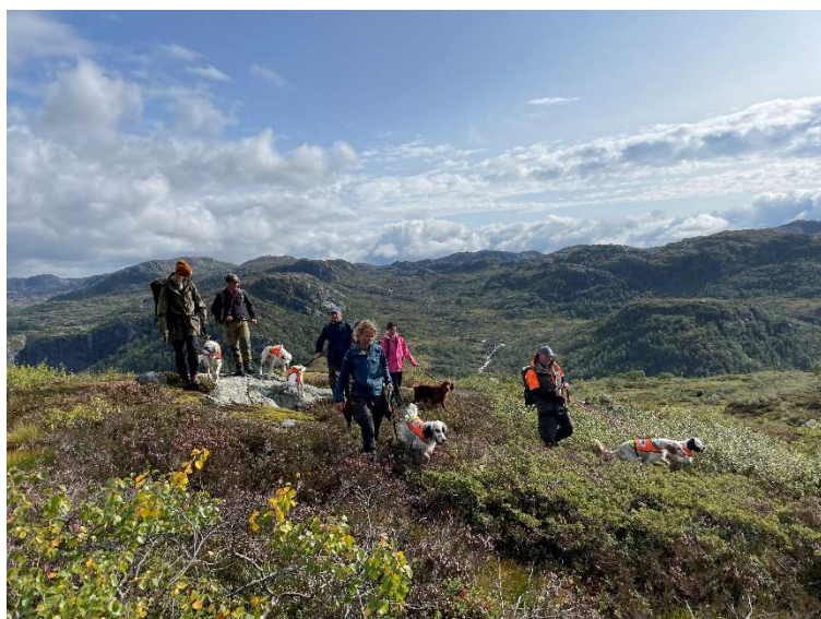
Det ble en dag med innslag av regn og sol.