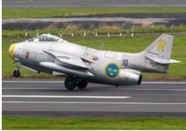
SAAB J29F Flygande Tunnan med Ebk