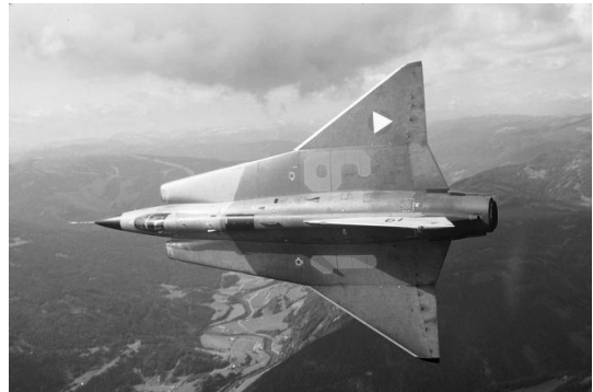
Vår J35OE nr 19 före landning framför museet

Syftet är att fortlöpande informera medlemmarna om den aktuella verksamheten i museet.