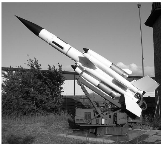
Bloodhound RB68 vid Arboga Robotmuseum