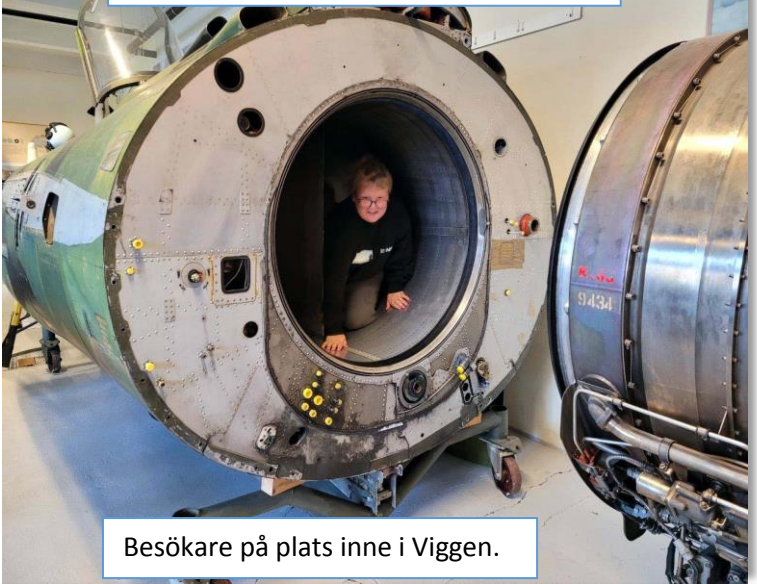
Besökare på plats inne i Viggen.