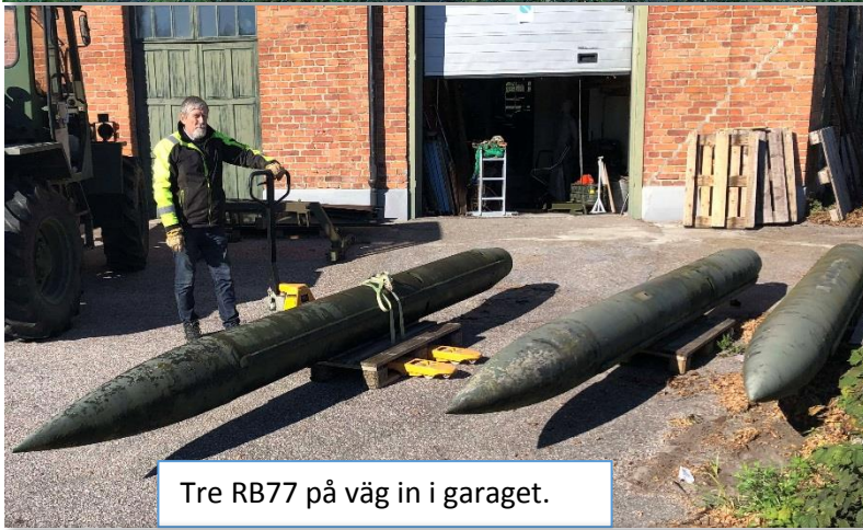
Tre RB77 på väg in i garaget.