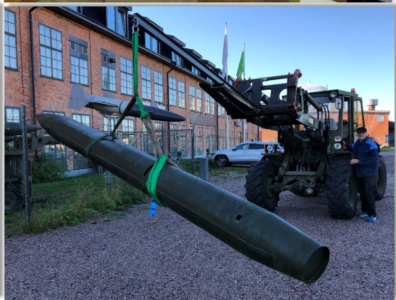
Lyftet gick ju bra.