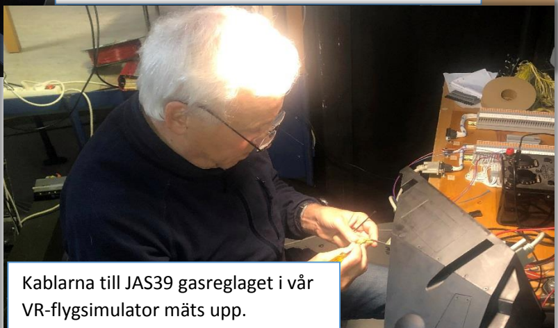
Kablarna till JAS39 gasreglaget i vår VR-flygsimulator mäts upp.