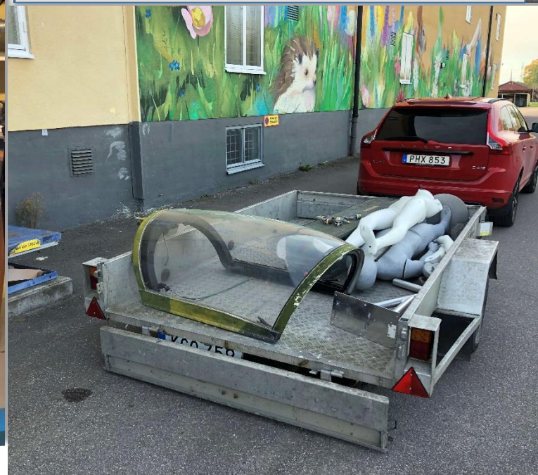
JA37C huven körs till externa förrådet Gösen.