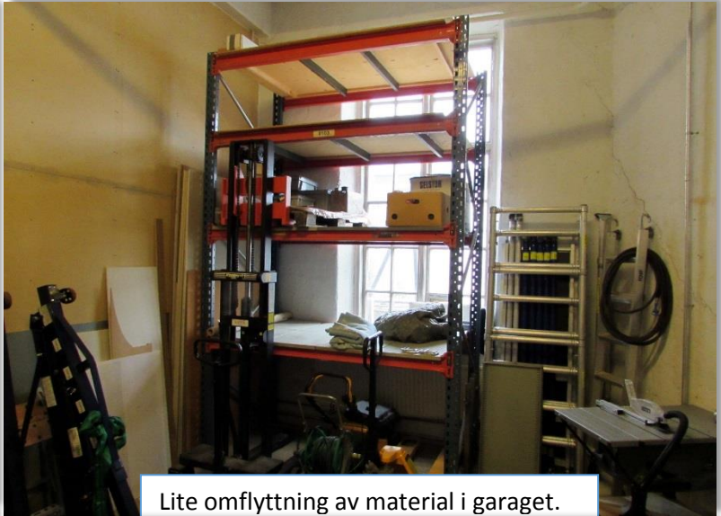
Lite omflyttning av material i garaget.