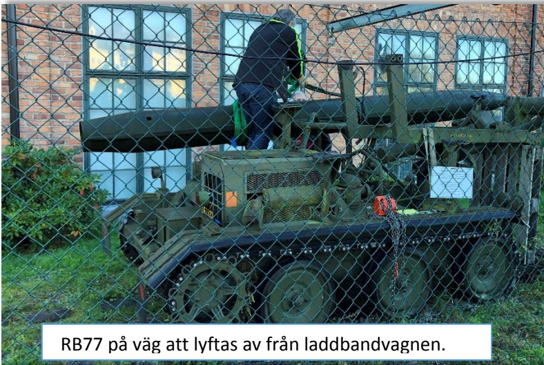
RB77 på väg att lyftas av från laddbandvagnen.