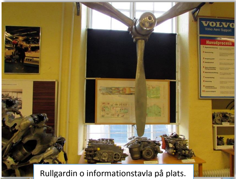
Rullgardin o informationstavla på plats.