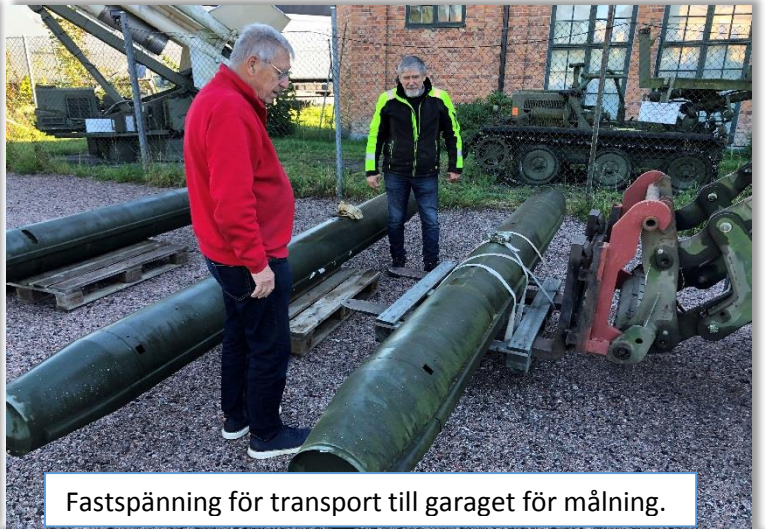
Fastspänning för transport till garaget för målning.