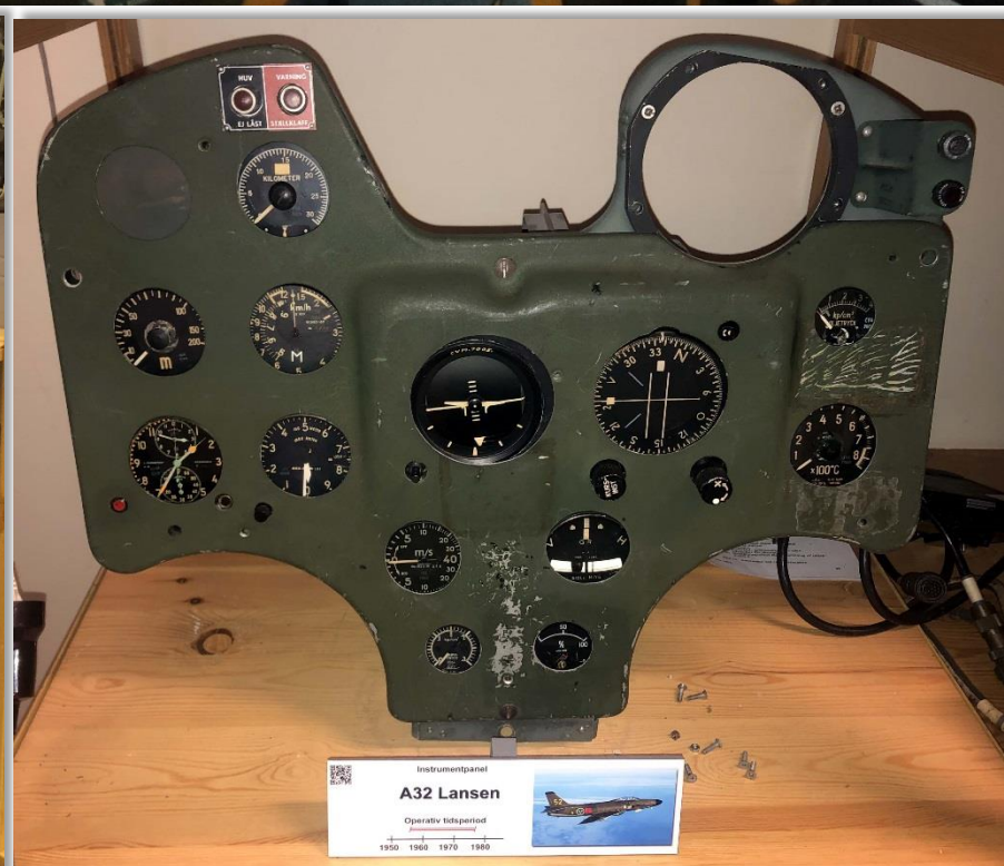
Nu är A32A Lansen instrumentbräda nästan komplett. Saknas en PN-50 panel som visades på förra sidan.