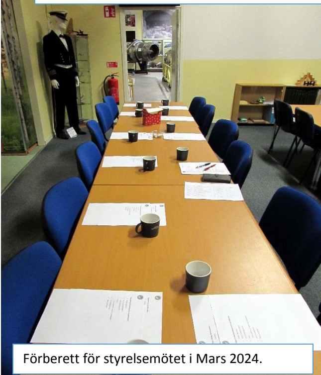
Förberett för styrelsemötet i Mars 2024.