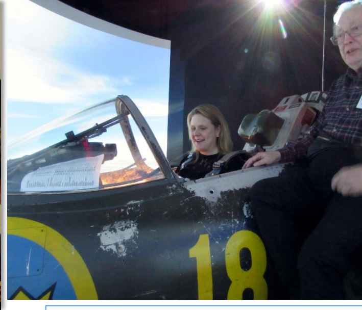
Flyger i vår 35 simulator. Ander leder flygningen.