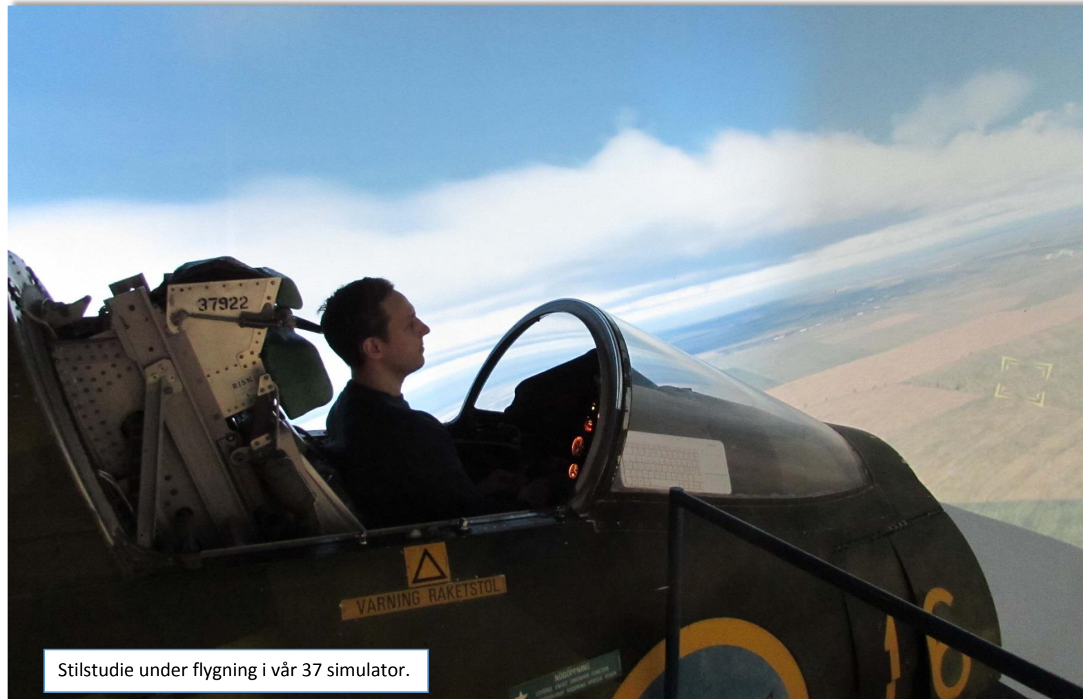
Stilstudie under flygning i vår 37 simulator.