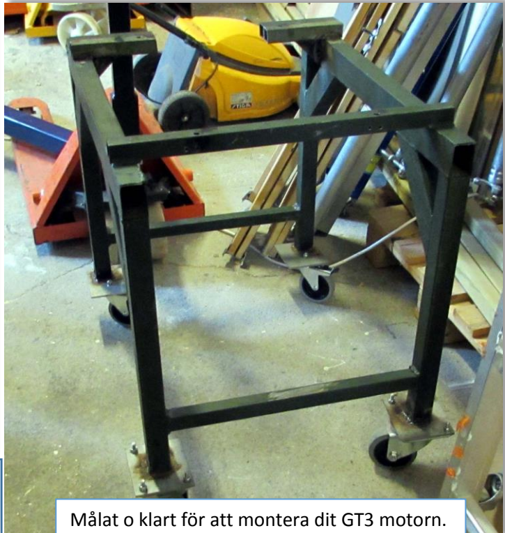
Målat o klart för att montera dit GT3 motorn.